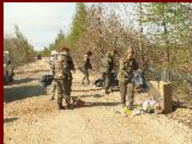
субботник в охранной зоне заповедника