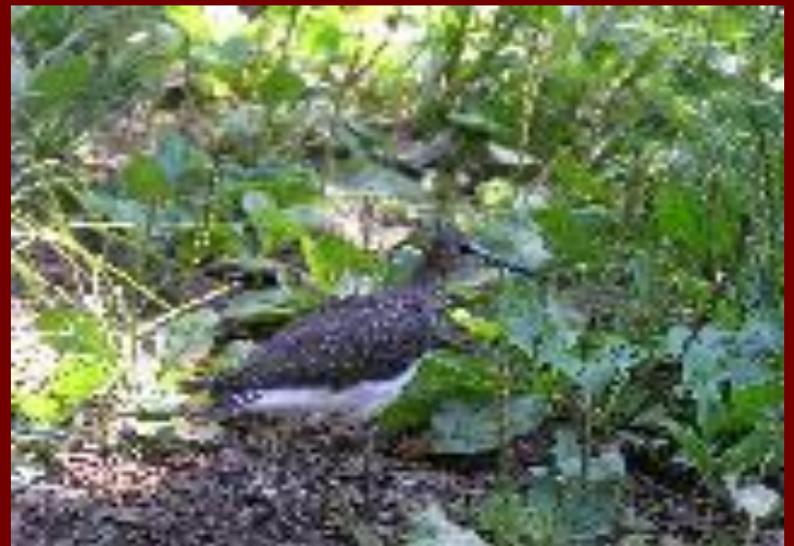
•Черныш - кулик