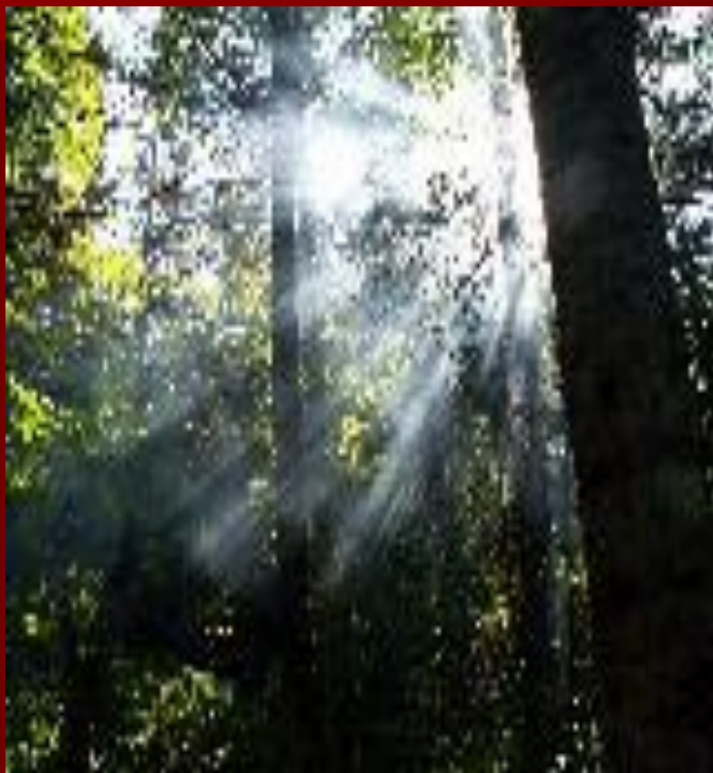
в лесной чаще