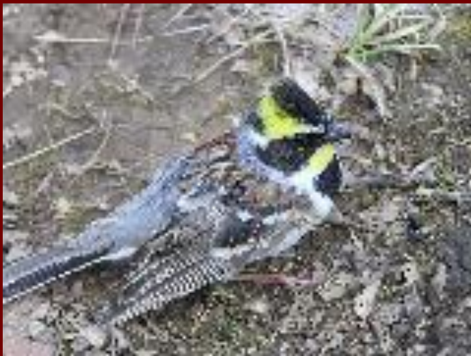
Самец желтогорлая овсянка