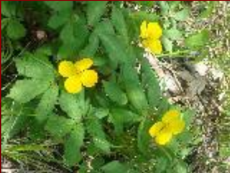
лесной мак весенний