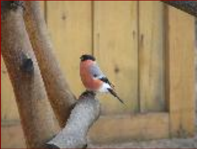
Обыкновенный снегирь самец