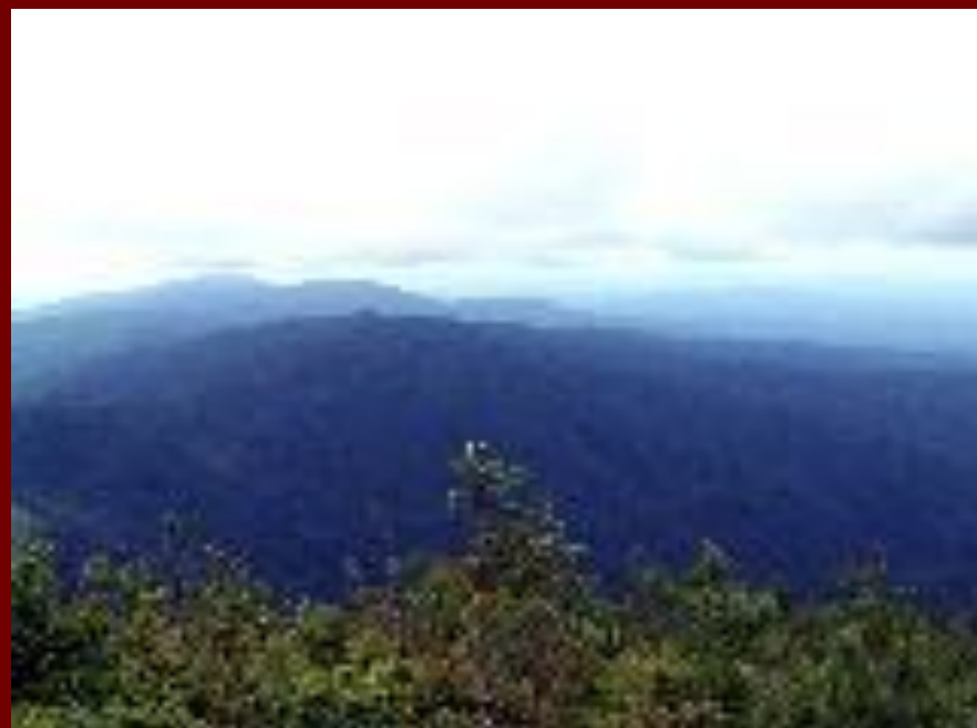
отроги Буреинского хребта