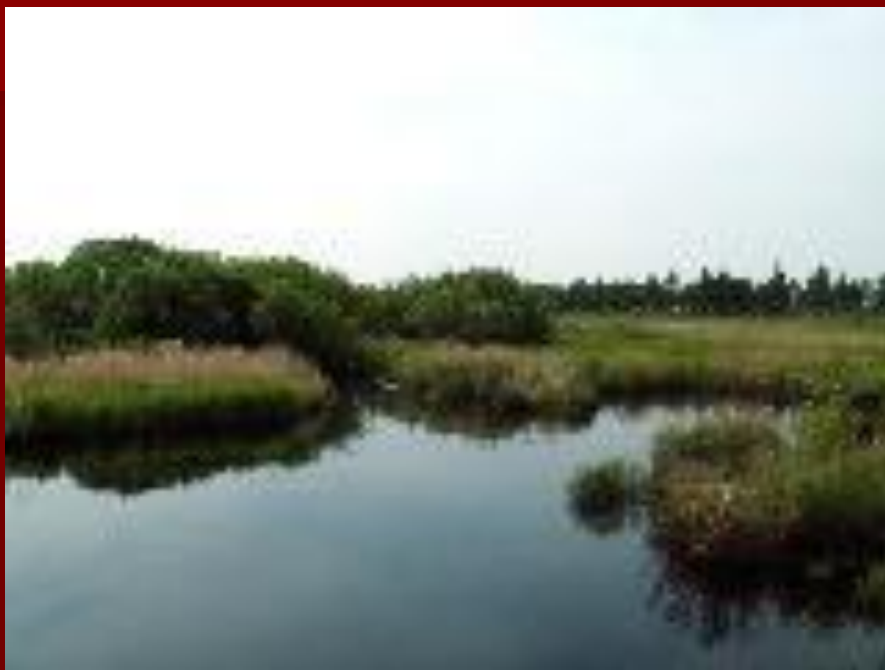
вид на р. Глинянка