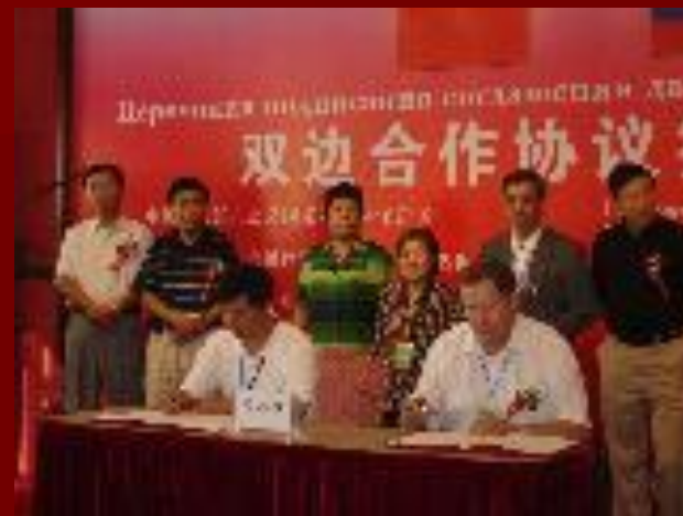
на церемонии подписания двустороннего договора о сотрудничестве