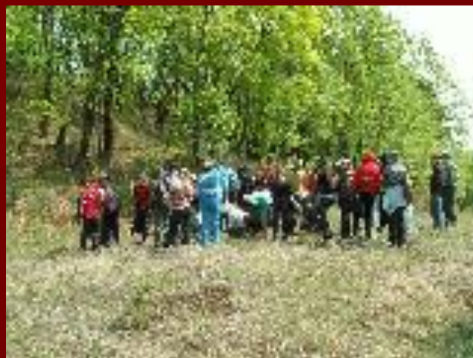
экскурсия в дендропарке