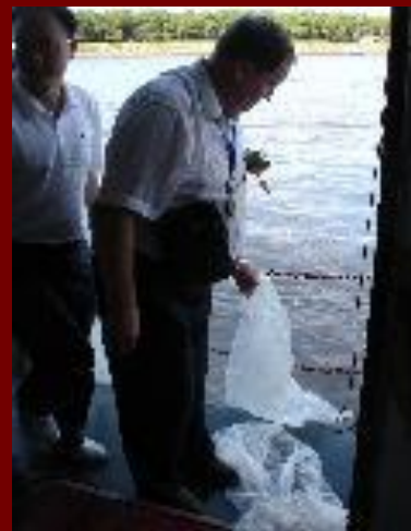
выпуск мальков в р. Сунгари