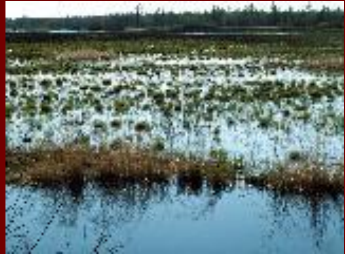
заповедные водно-болотные угодья