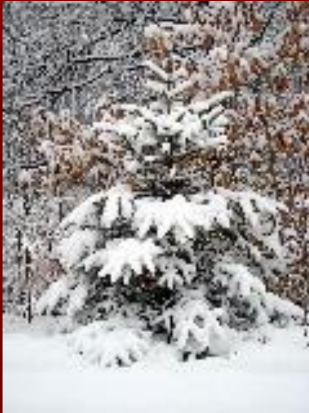
ель под снегом