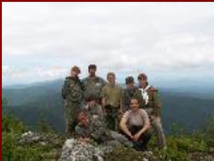
на вершине г.Быдыр