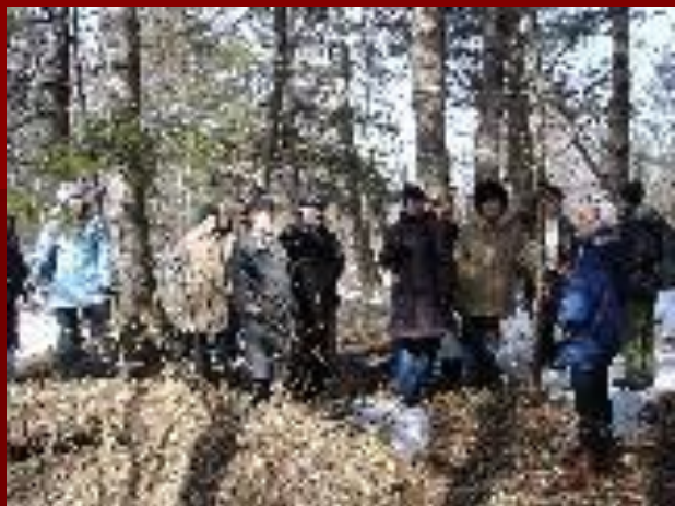
экскурсия на экотропе