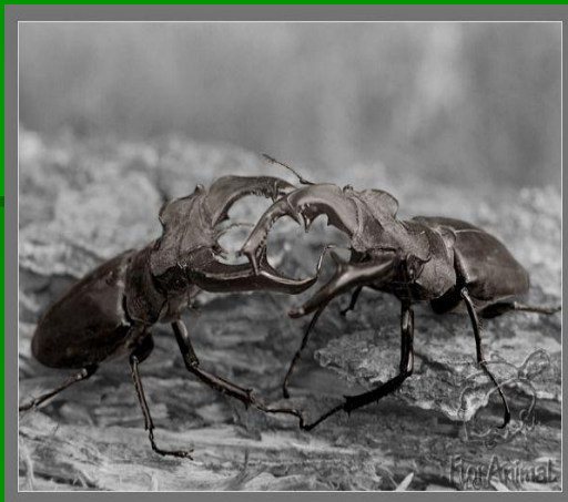
жук - олень