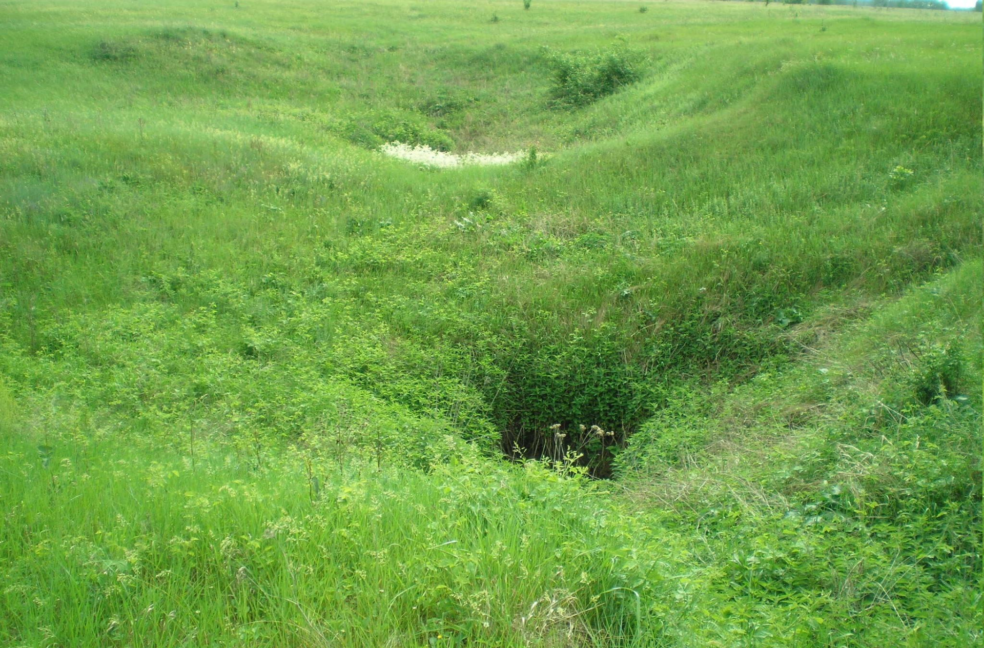
Урочище Морозова гора