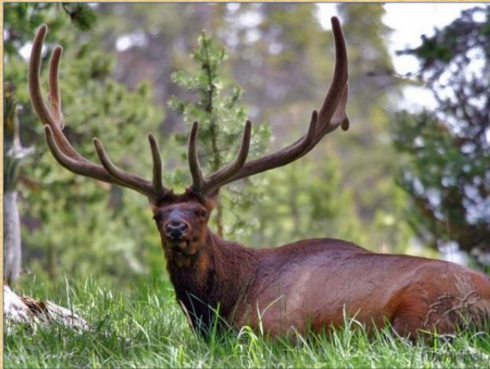
Изюбрь – дальневосточная форма настоящего оленя.