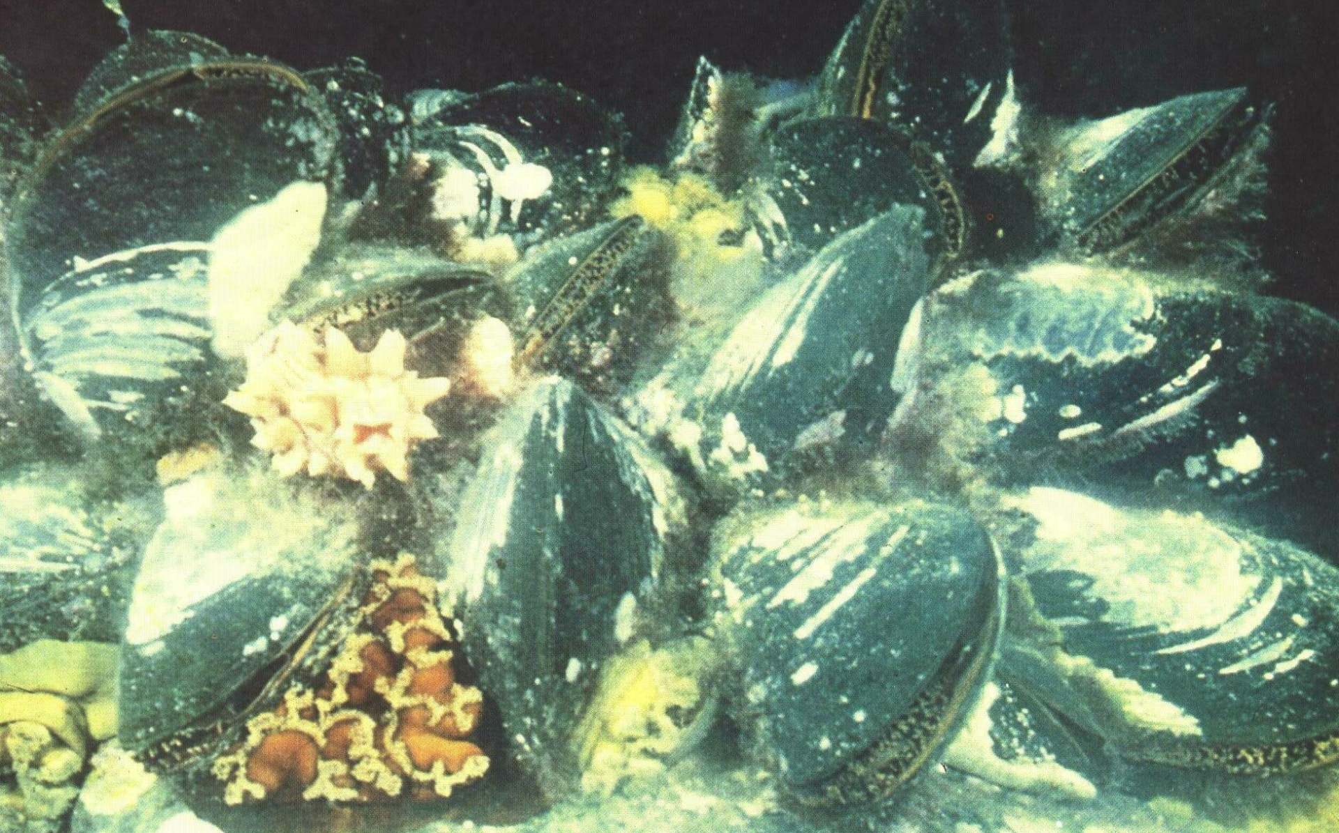
МИДИИ ГРЕЯ В СООБЩЕСТВЕ С АСЦИДИЕЙ И АКТИНИЯМИ