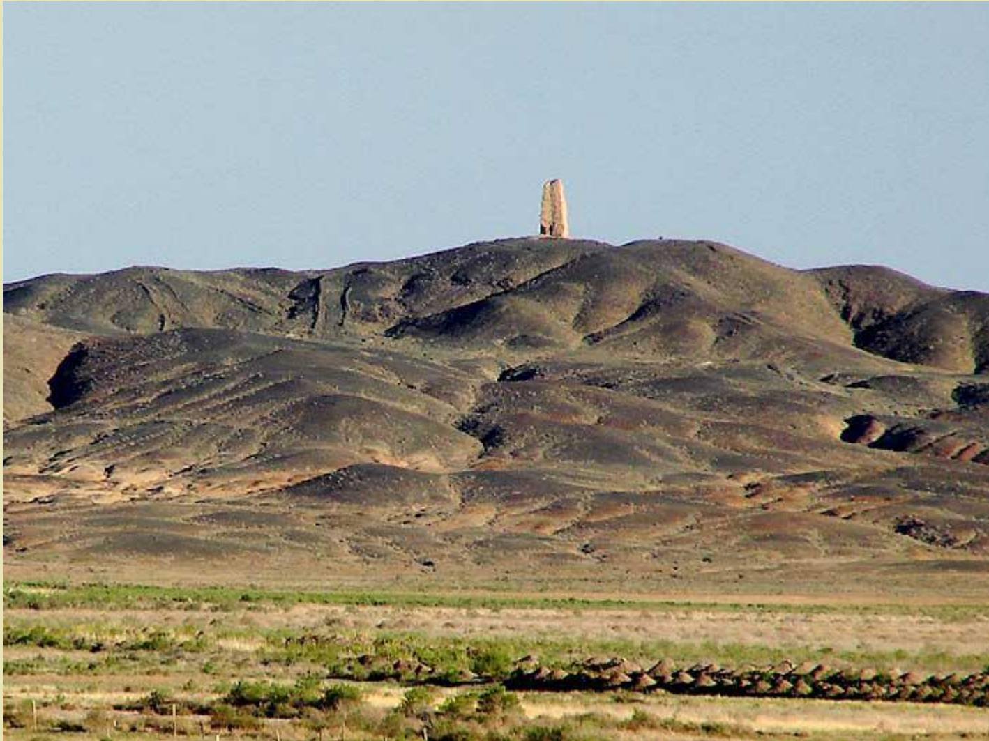
Каратауский государственный природный заповедник