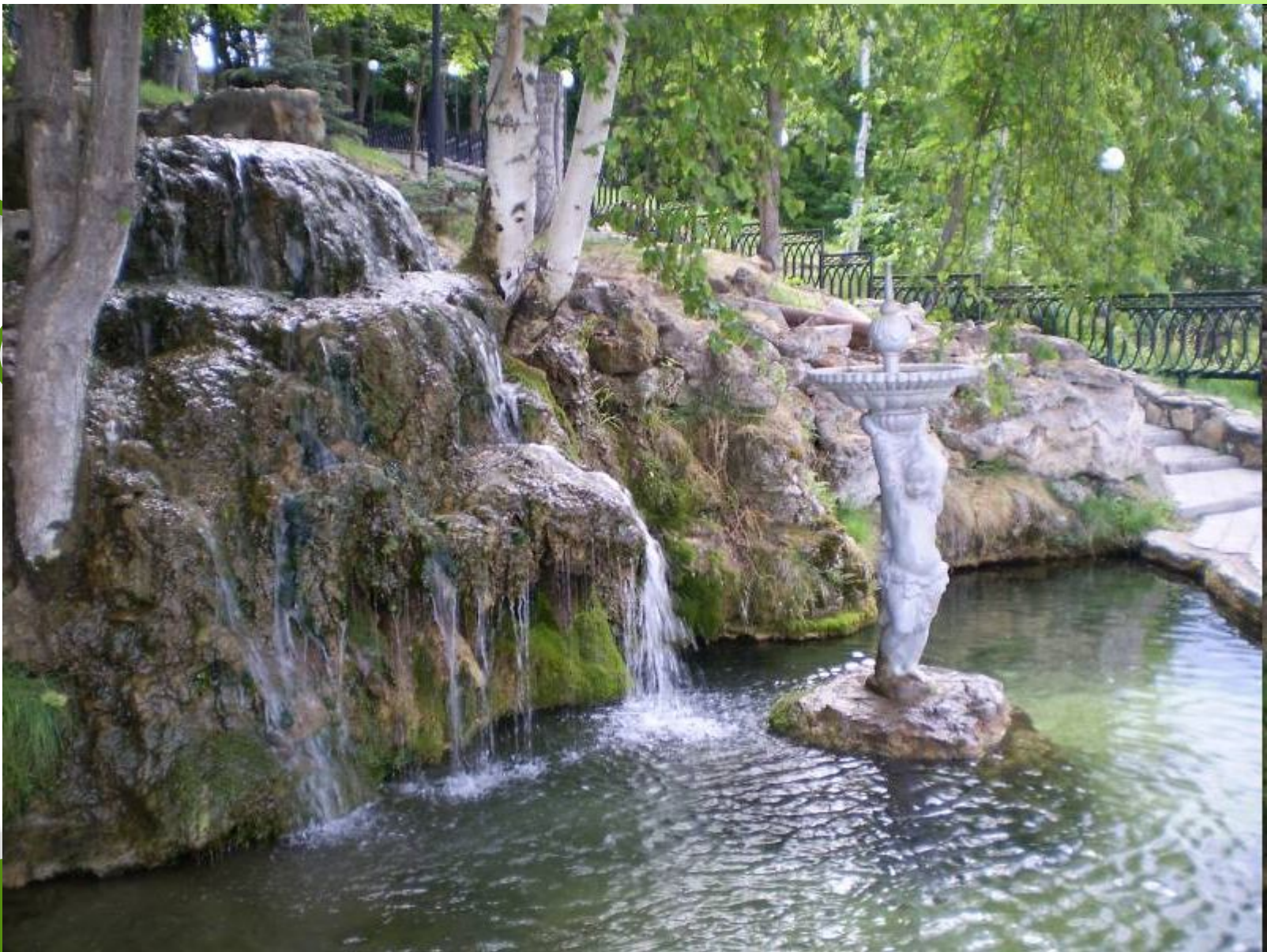
Боровецкие ключи г. Набережные Челны