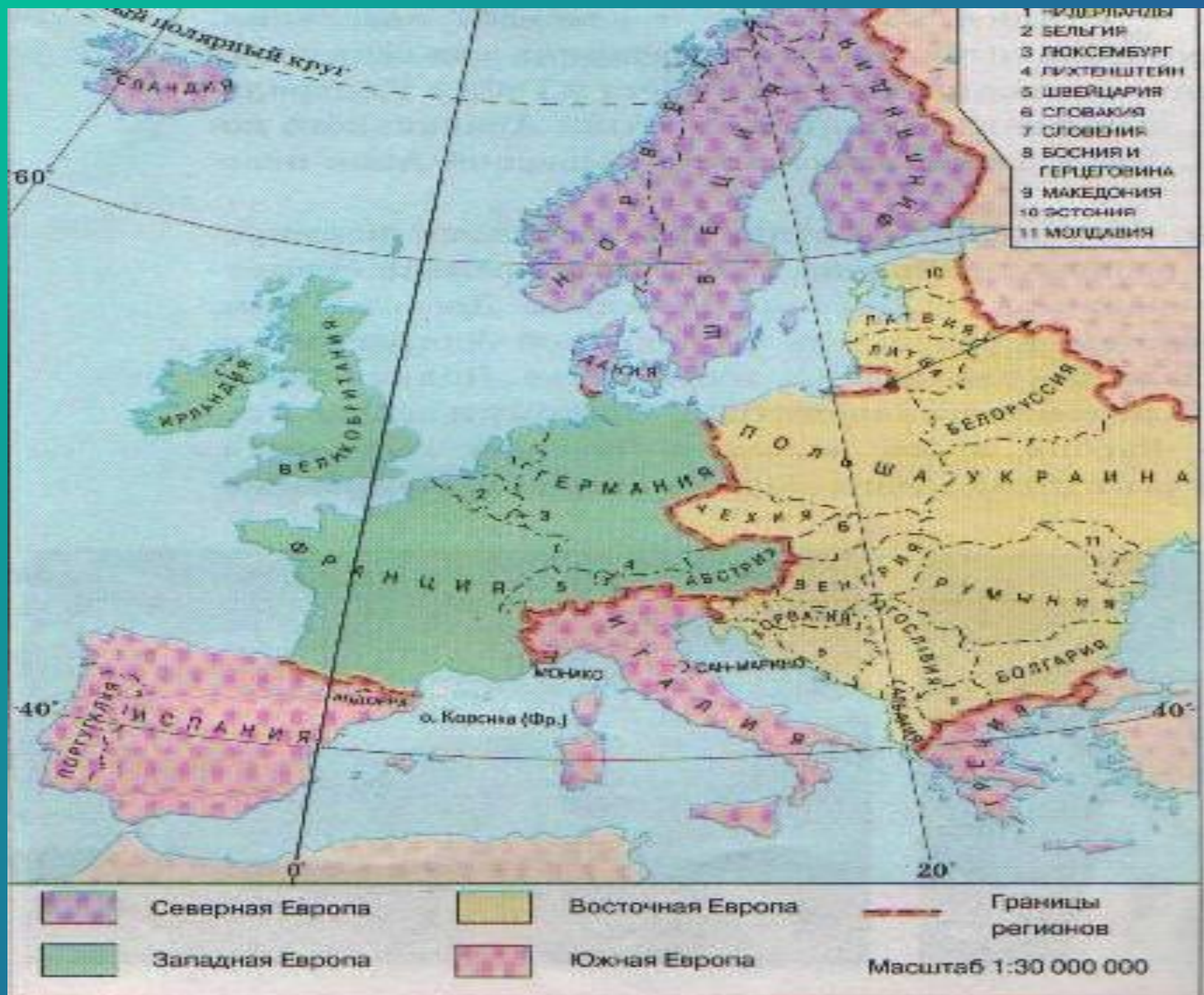
Рис. 103. Регионы и страны зарубежной Европы