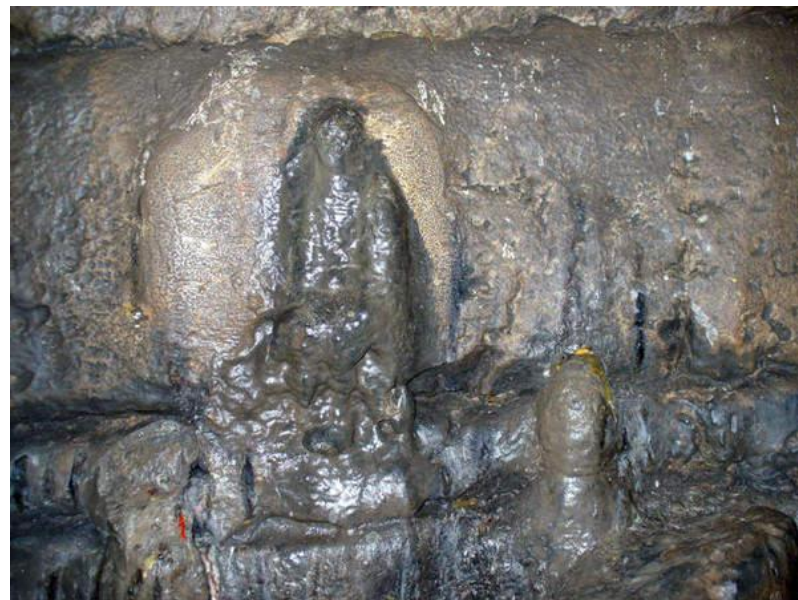
Нерукотворное чудо – Игнатьевская богоматерь