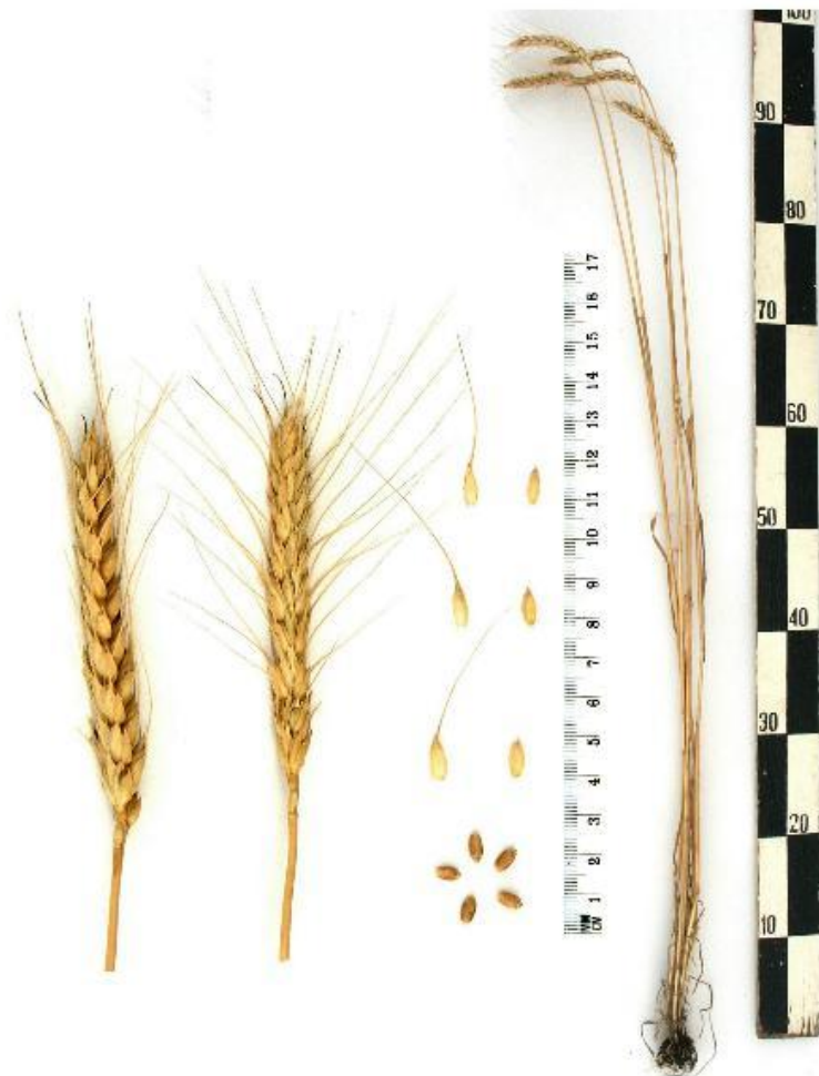
Озимая Мягкая пшеница КД Альянс