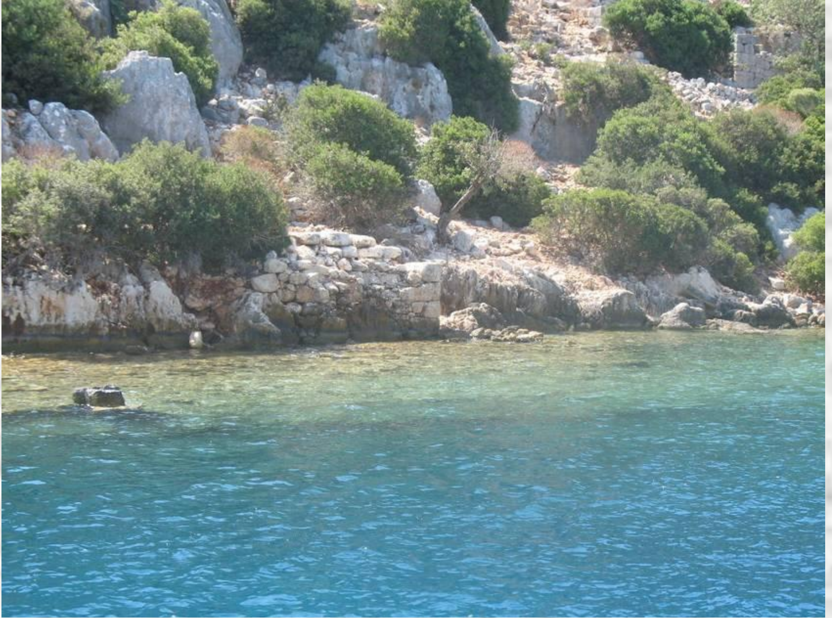
Кеково - древний город, ушедший под воду после землетрясения.