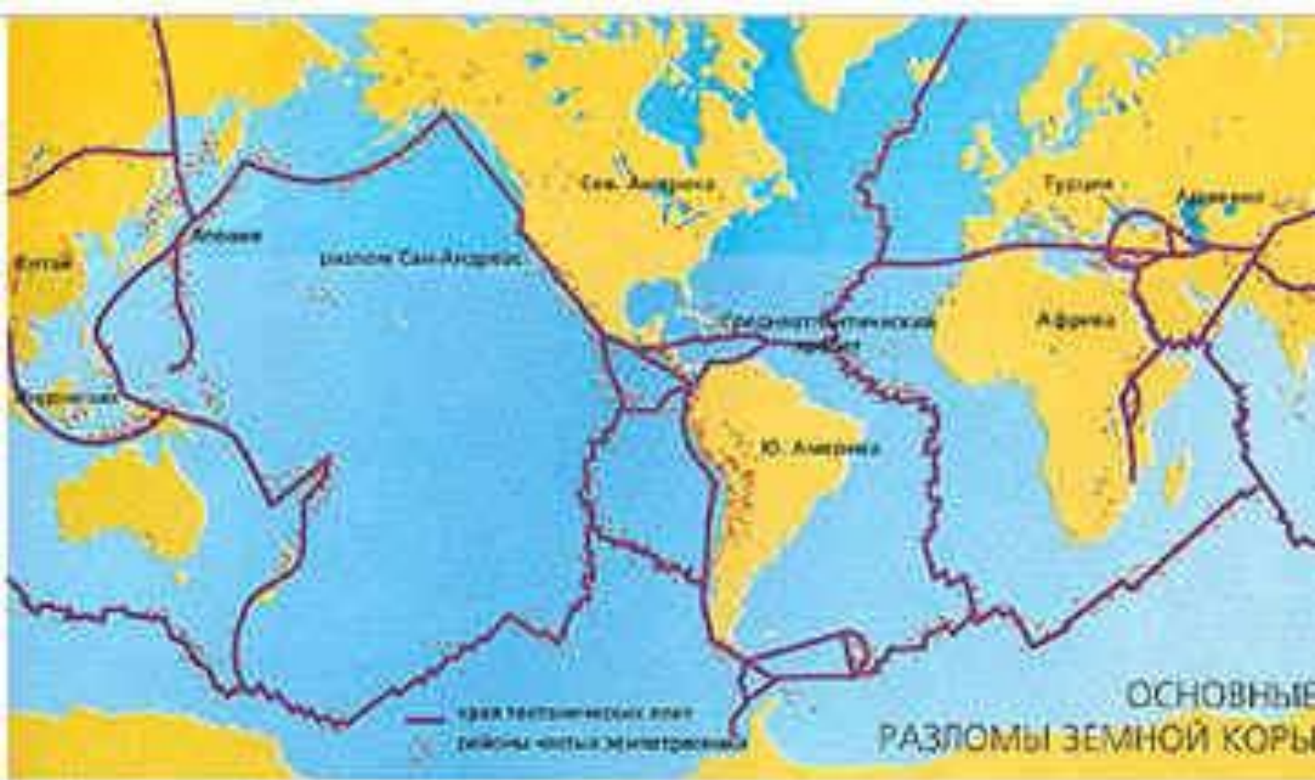
Карта землетрясений мира. Границы тектонических плит.