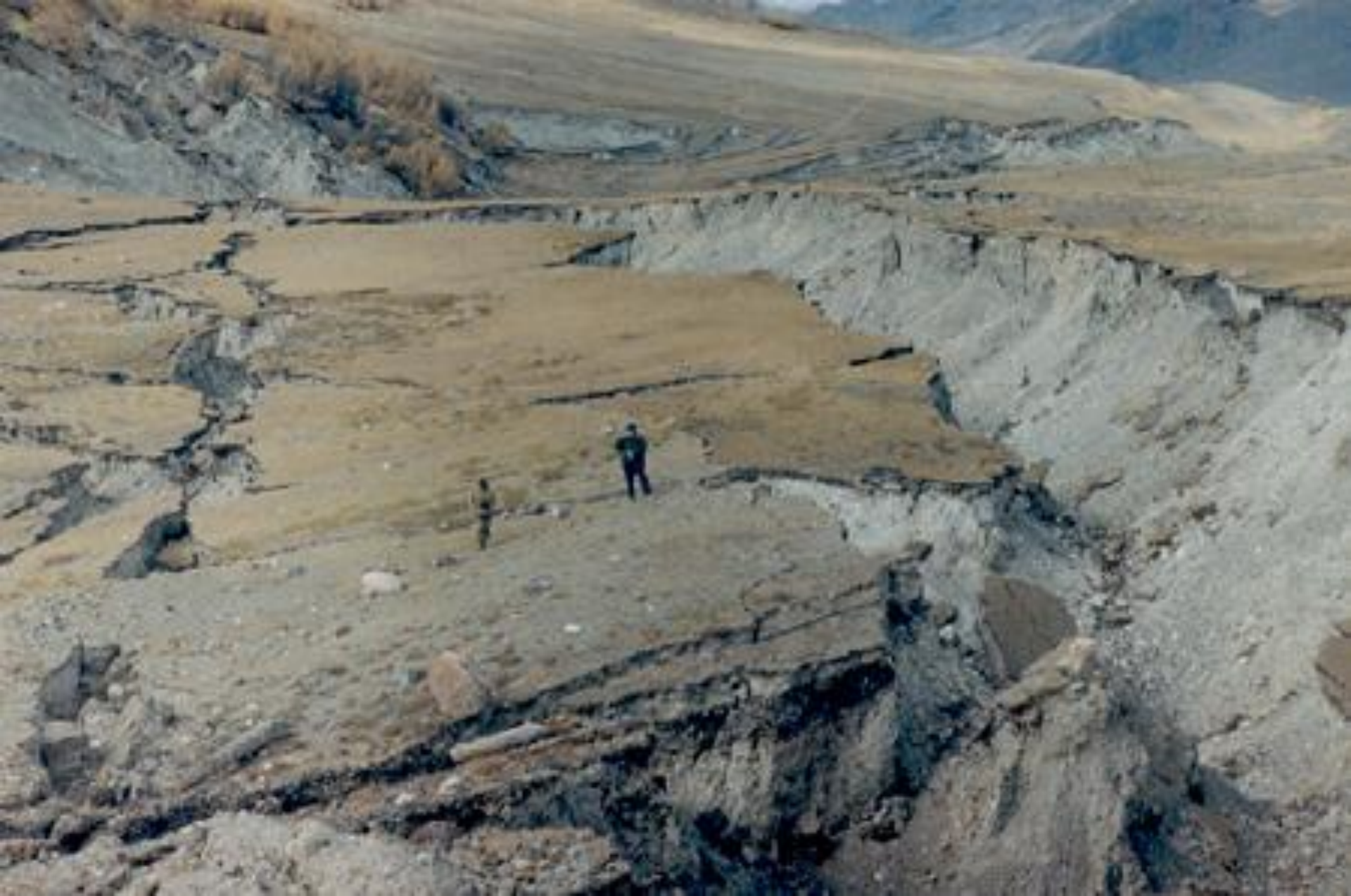
Результаты землетрясения на территории Юго-Восточного Алтая