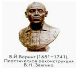
В.И.Беринг (1681–1741). Пластическая реконструкция В.Н. Звягина