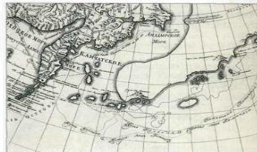
Карта открытий российских мореплавателей. Около 1770 г.