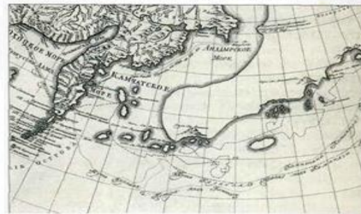
Карта открытий российских мореплавателей. Около 1770 г.