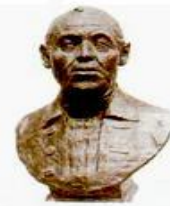
В.И. Беринг (1681–1741). Пластическая реконструкция В.Н. Звягина