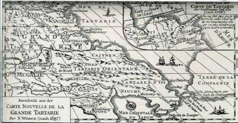
Фрагмент карты Великой Тартарии голландского мореплавателя Н. Витсена. 1678 г. В восточной части показаны о. Шатров и пролив Фриза