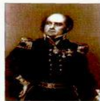
Дж. Франклин (1786–1847), английский полярный исследователь. Руководил полярными экспедициями, открывшими арктическую час побережья Северной Америки