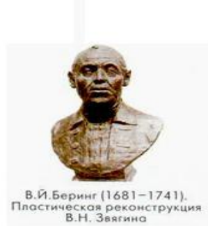
В.И.Беринг (1681–1741). Пластическая реконструкция В.Н. Звягина