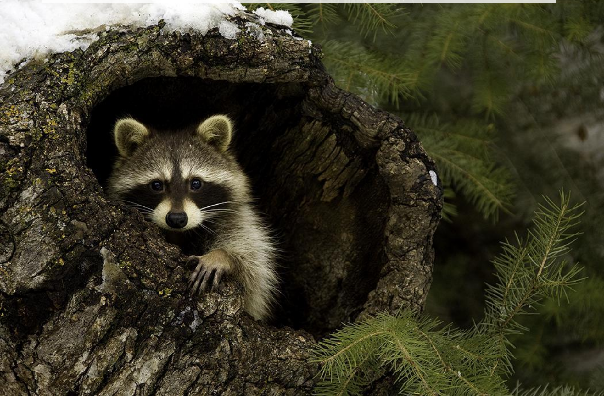
ЕНОТ – ПОЛОСКУН