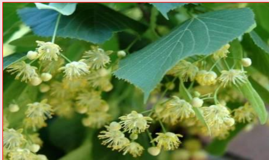
Ветки ясеня и липы