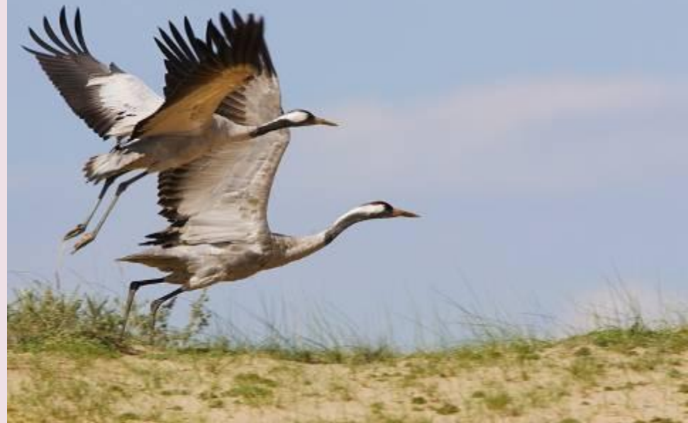
Лебедь- шипун и журавли