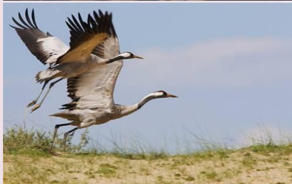
Лебедь- шипун и журавли