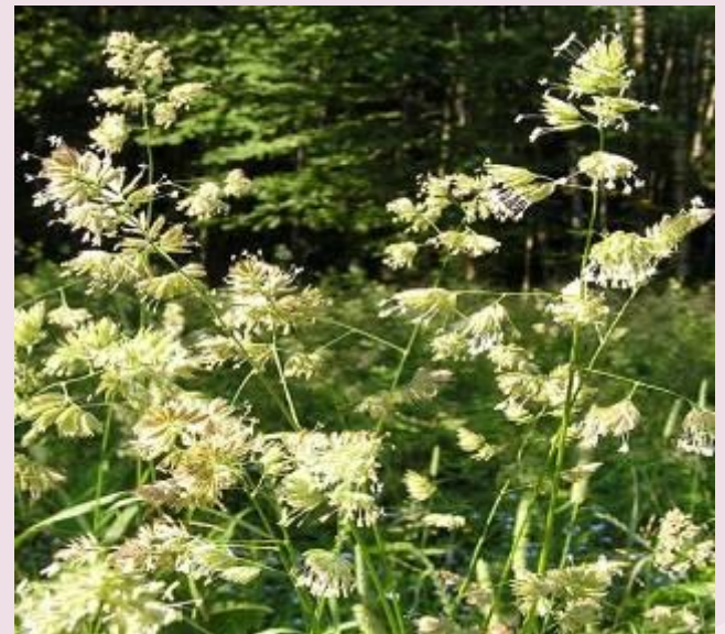
Полевица и ежа сборная