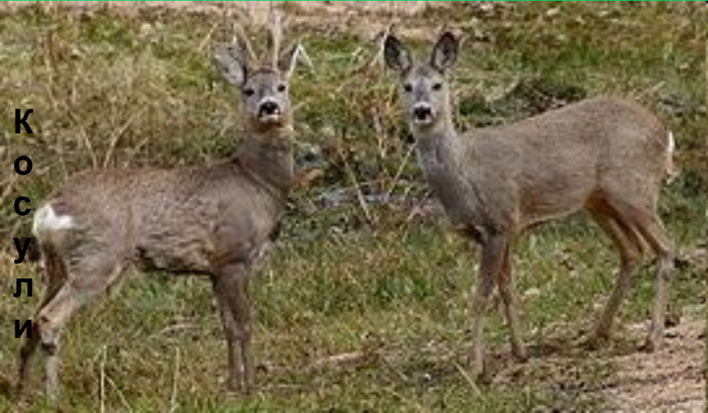
К о с у л и