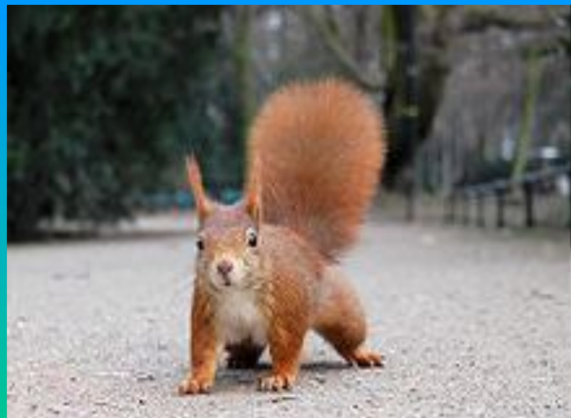
Рыжая или обыкновенная белка