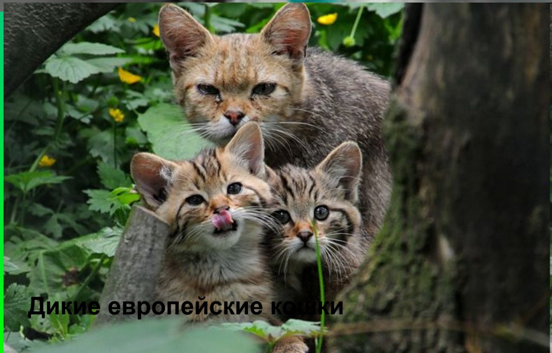
Дикие европейские кошки