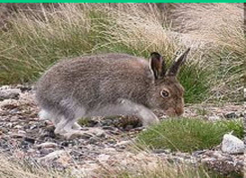
Заяц-беляк в Шотландии.