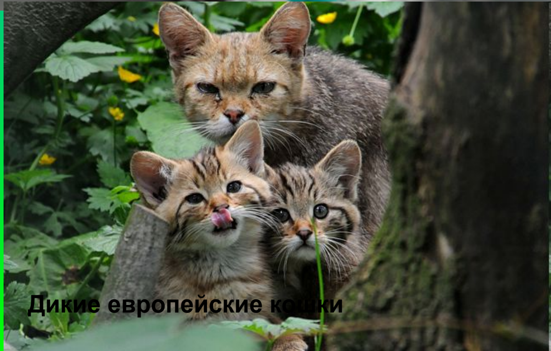
Дикие европейские кошки