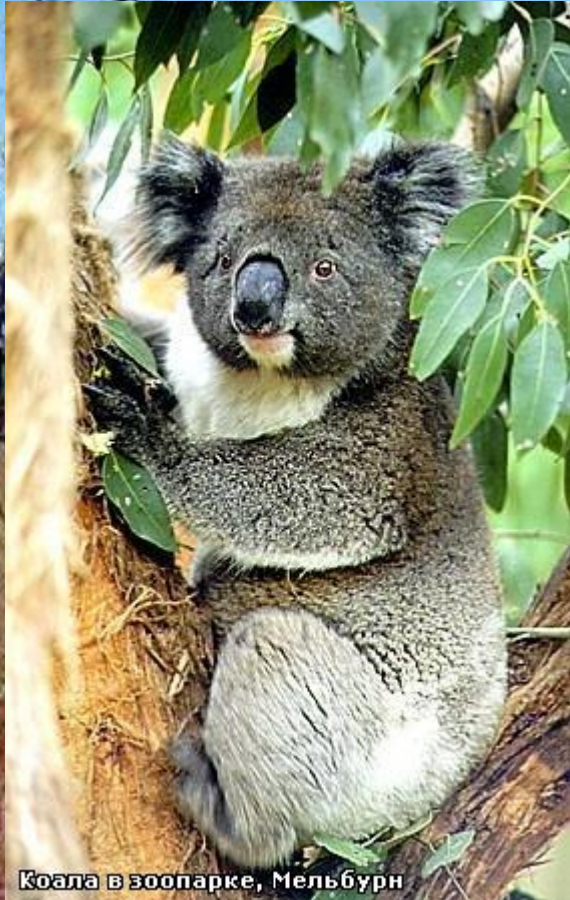
Коала в зоопарке, Мельбурн