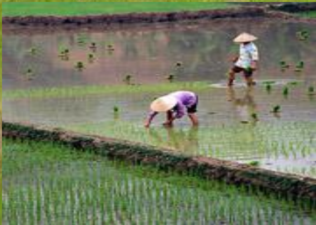
Рис – называют «сыном воды и Солнца». Выращивают его на полях залитых водой.