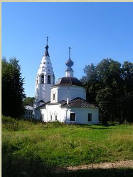
Успенский собор на Соборной горе