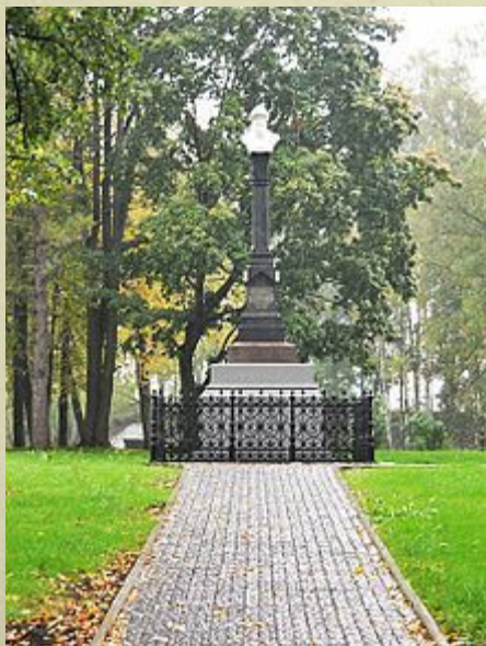
Памятник основателю города князю Василию