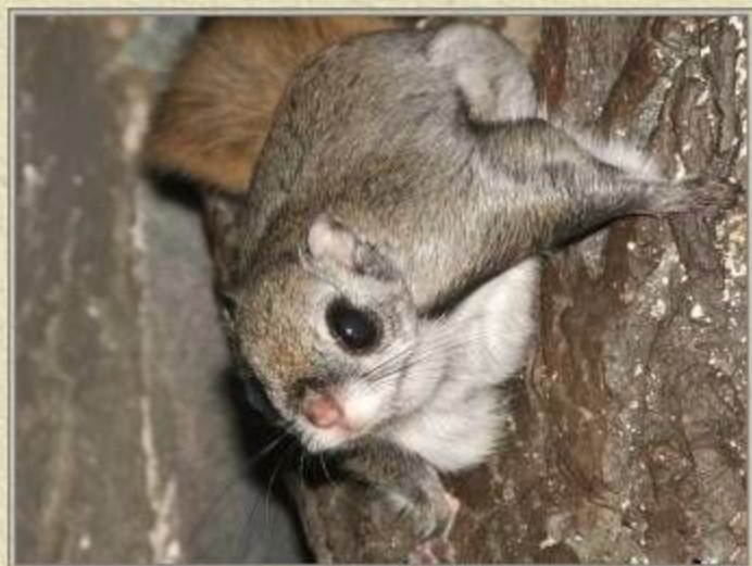
Белка – летяга