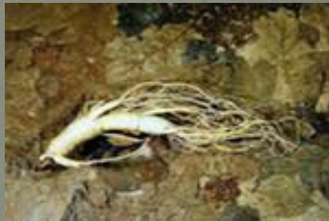
Женьшень (корень жизни)