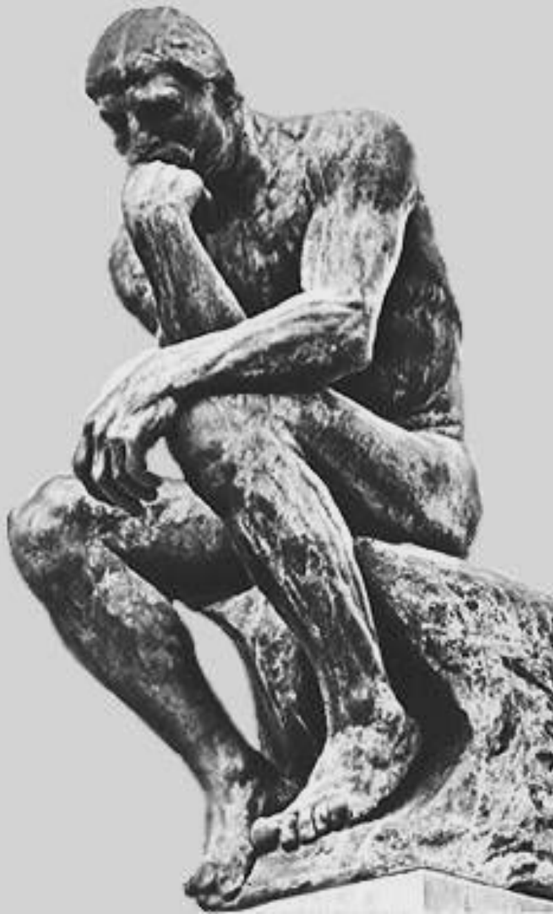
Огюст Роден. «Мыслитель». Бронза. 1888. Музей Родена. Париж.