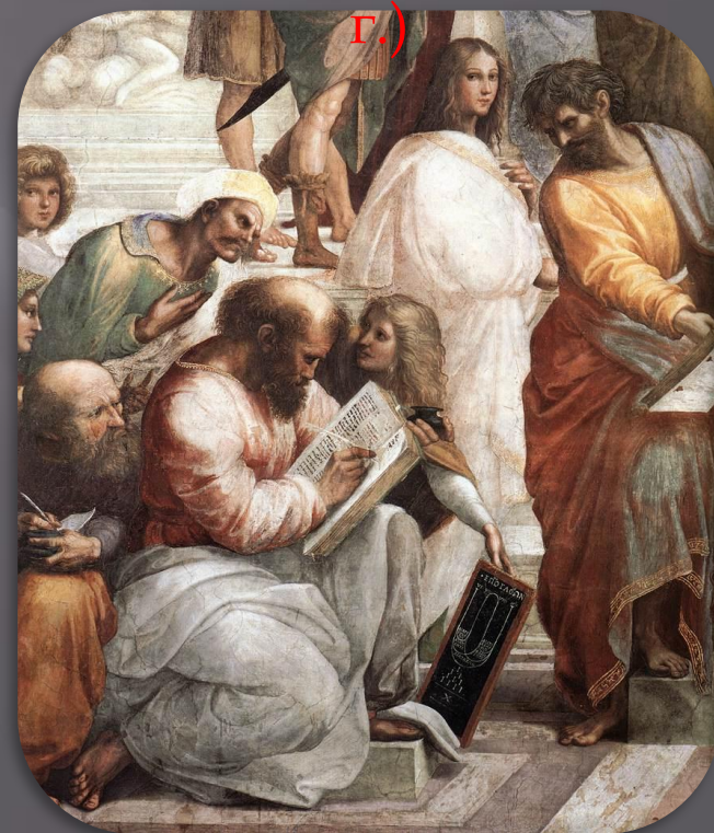
Пифагор на фреске Рафаэля (1509