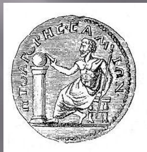
Монета с изображением Пифагора