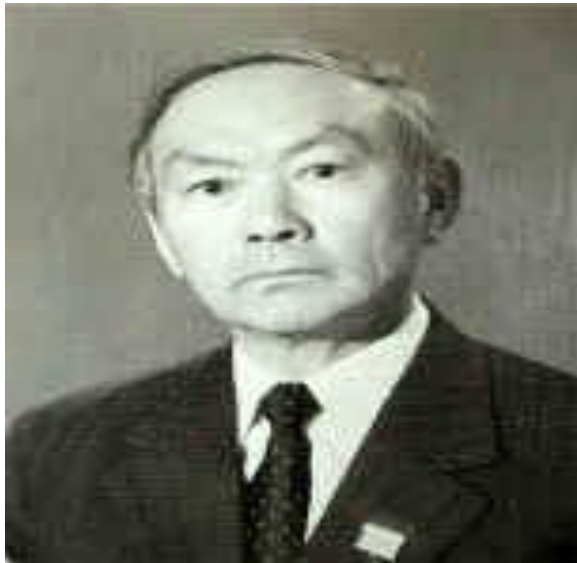
Жәутікөв Орынбек Ахметбекұлы (1911-1989) – ғалым, физика-математика ғылымдарының докторы, профессор, Қазақстан Ғылым академиясының академигі, Қазақстанның еңбек сіңірген ғылыми және техника қайраткері, Қазақстанның Мемлекеттік сыйлығының лауреаты.

1920-1930 жылдары ауылдық мектепте, кейіннен Қарқаралы қаласындағы мектепте оқыған. 1934 жылы Қазақ педагогикалық институтының (Абай атындағы Қазақ Ұлттық педагогикалық университеті) физика-математика факультетін үздік бітіріп, Ленинград мемлекеттік университетінің (Санкт-Петербург мемлекеттік университеті) аспирантурасын тамамдаған.