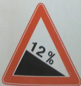
1.13 Крутой спуск