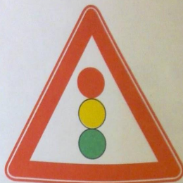
1.8 Светофорное регулирование