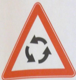
1.7 Пересечение с круговым движением