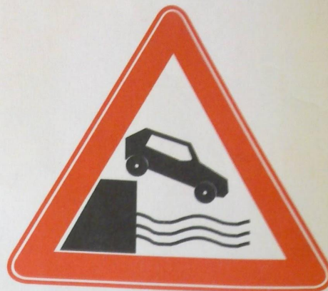
1.10 Выезд на набережную