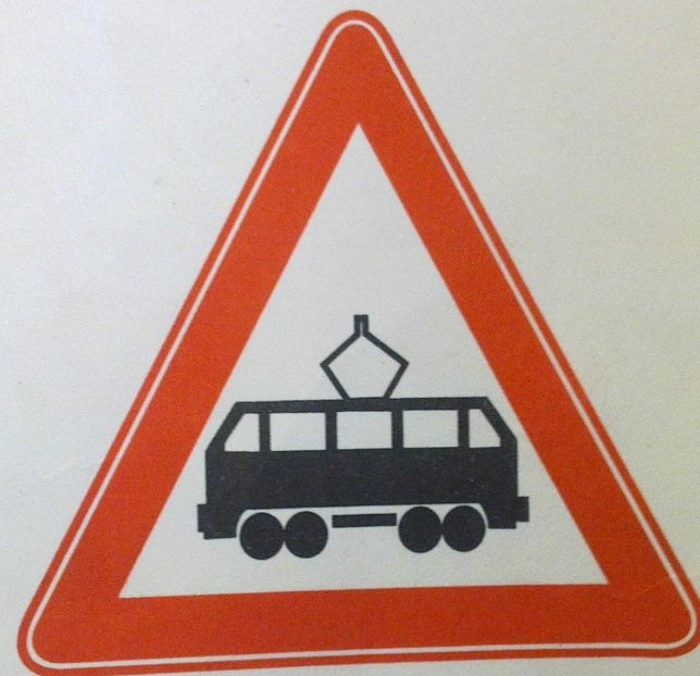
1.5 Пересечение с трамвайной линией