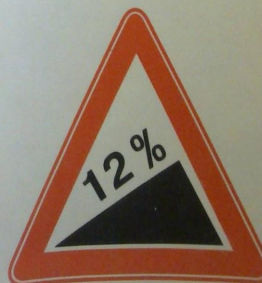
1.14 Крутой подъем