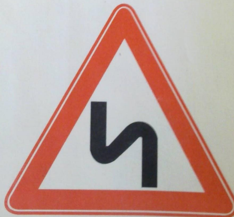
1.12.2 Опасные повороты