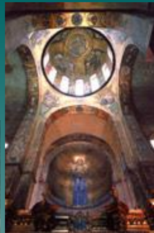
Богоматерь Оранта и полуфигура Вседержителя