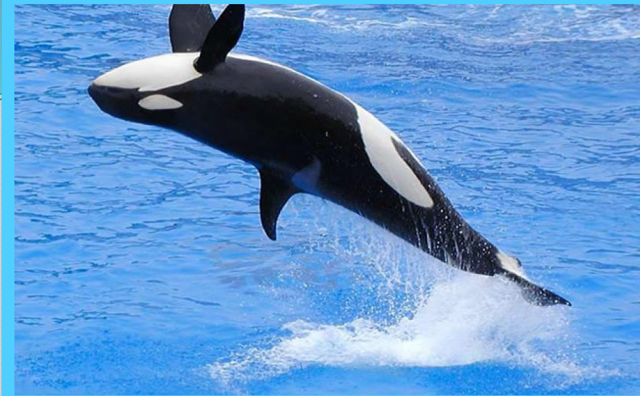
К осатка – водное млекопитающее семейства дельфиновых