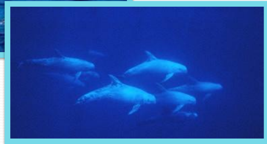
Серый дельфин (грампус)