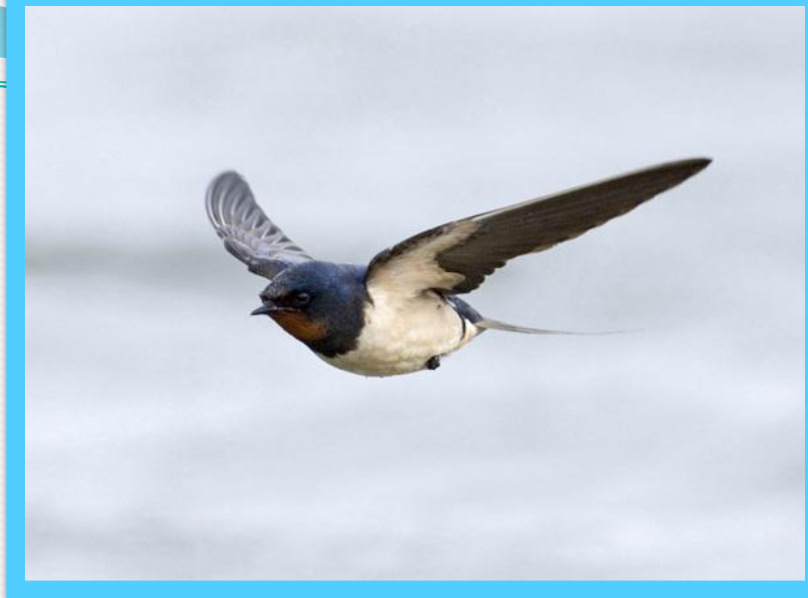
К асатка – деревенская ласточка