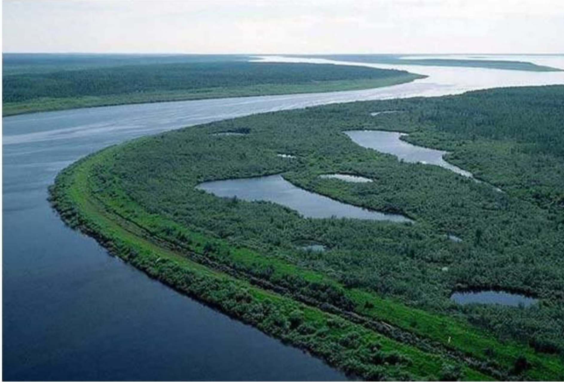
Река Енисей, Россия