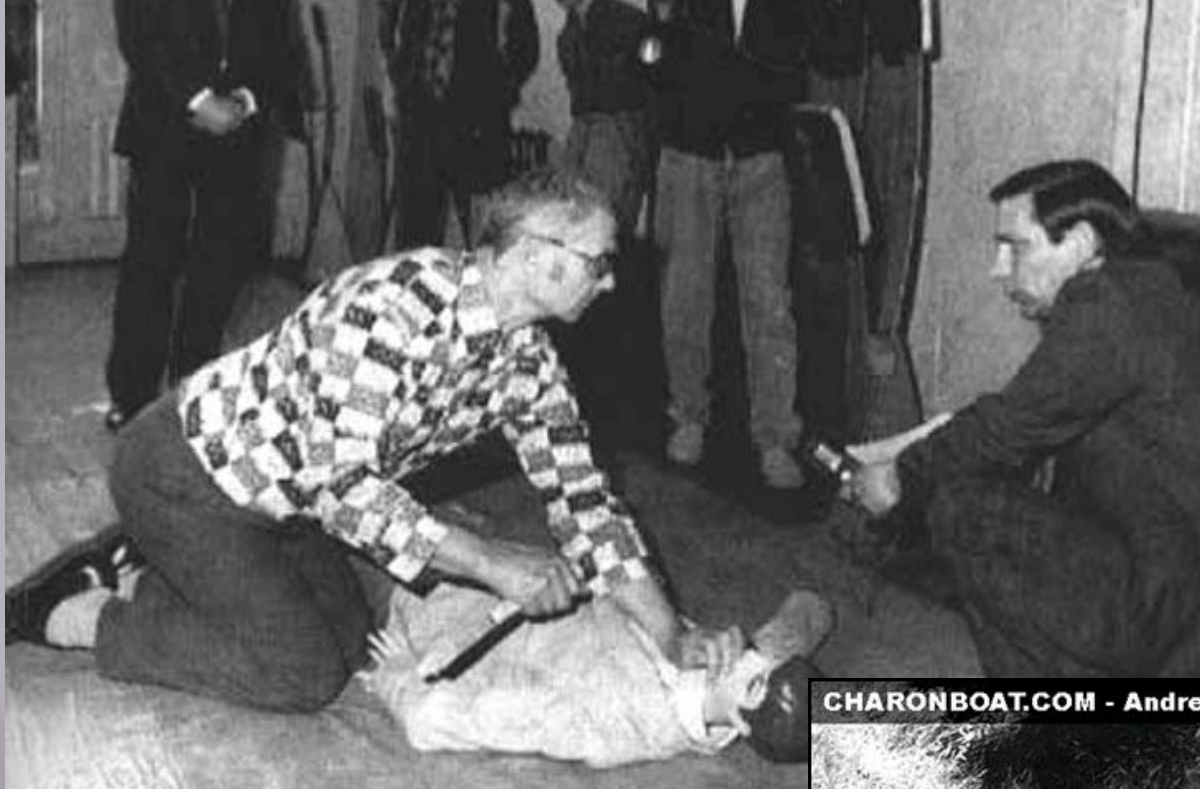
Andrei Chikatilo's Victim 4