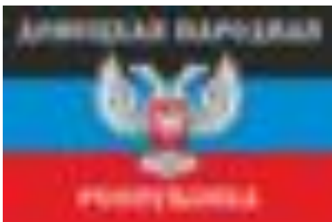
Донецкая Народная Республика