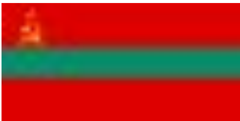
Приднестровская Молдавская Республика