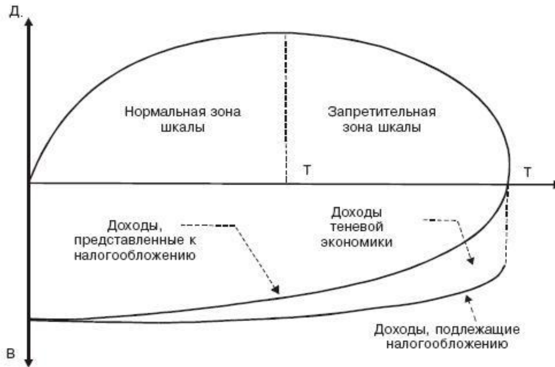
Рис. 2. Кривая Лаффера. Форма II

Поскольку уменьшение налогооблагаемой базы происходит медленнее, чем увеличение ставки, доходы бюджета возрастают.