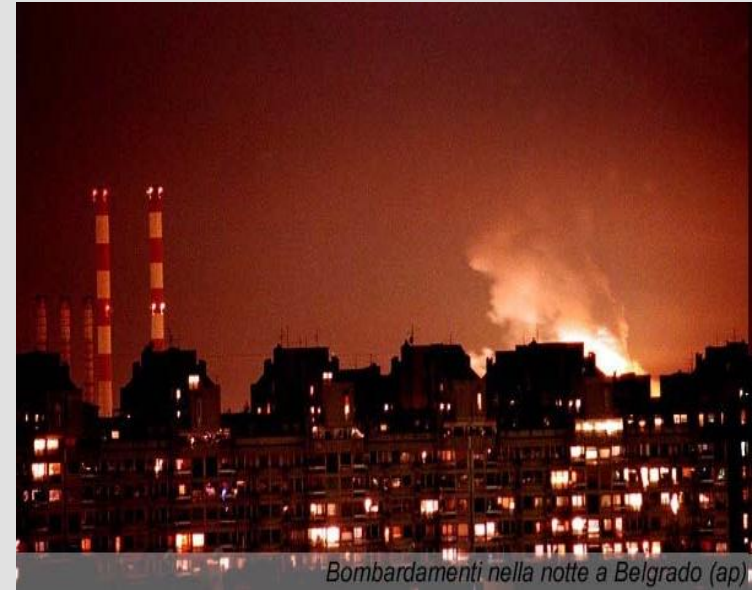
Bombardamenti nella notte a Belgrado

Руководство России осудило эти действия как агрессию и потребовало созыва Совета Безопасности ООН. Были прерваны отношения России с НАТО.