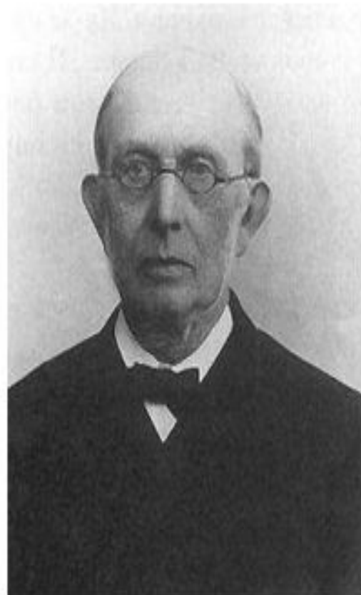
Ученый-правовед и публицист, обер- прокурор Синода Константин Петрович Победоносцев (1827 – 1907)