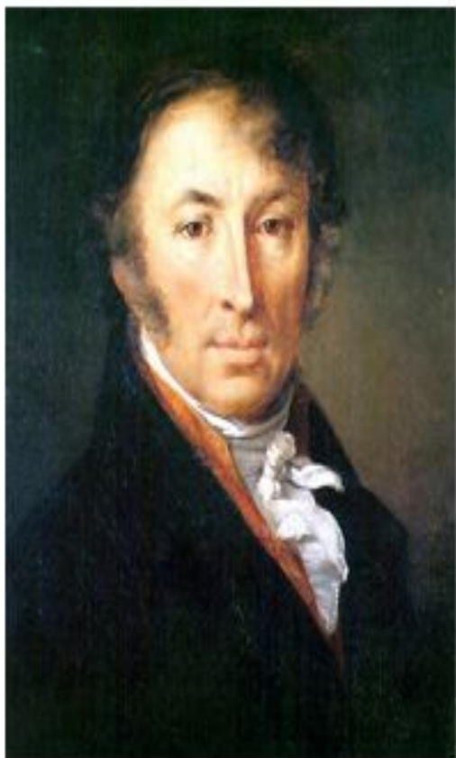
Историк, писатель, академик, действительный статский советник Николай Михайлович Карамзин (1766-1826)