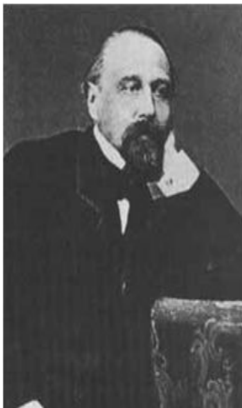
Публицист, издатель журнала "Русский вестник" и газеты "Московские ведомости", тайный советник Михаил Никифорович Катков (1818-1887)