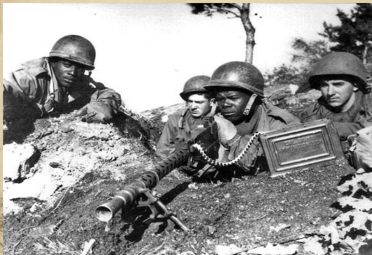
Война в Корее (1950–1953 гг.)