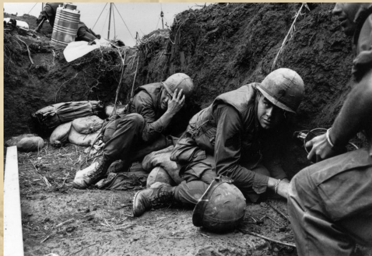
Война во Вьетнаме (1964–1975 гг.)