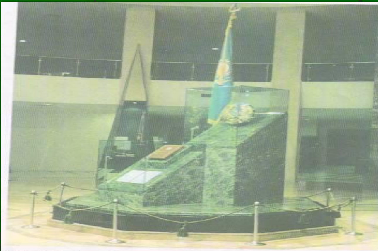
Еліміздің Туы, Елтаңбасы, Әнұраны, Конституциясы қойылған орын. ҚР Президенттік мәдениет орталығы.

1992 жылы 4-маусымда жаңа мемлекеттік рәміздер: Елтаңба, Ту, Әнұраны бекітілді.