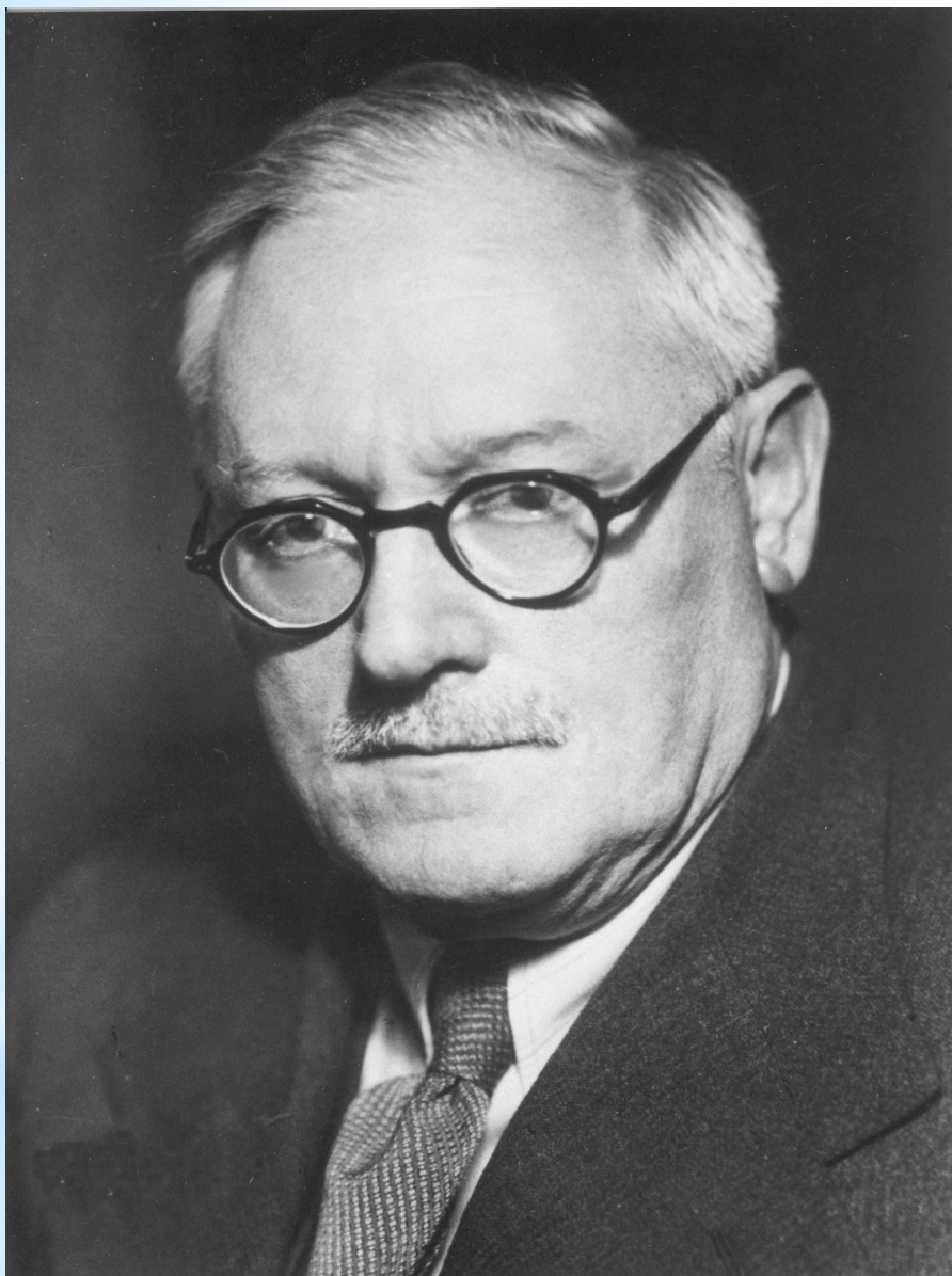
Андрей Януарьевич Вышинский - глава советской делегации ООН.