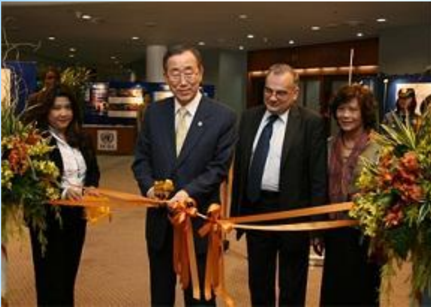
Генеральный секретарь ООН Пан Ги Мун на праздновании Дня прав человека в 2007 году.