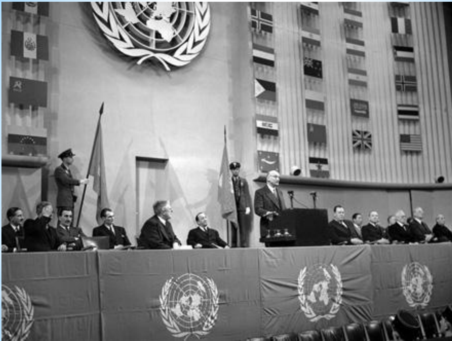
Принятие Международной Декларации прав человека