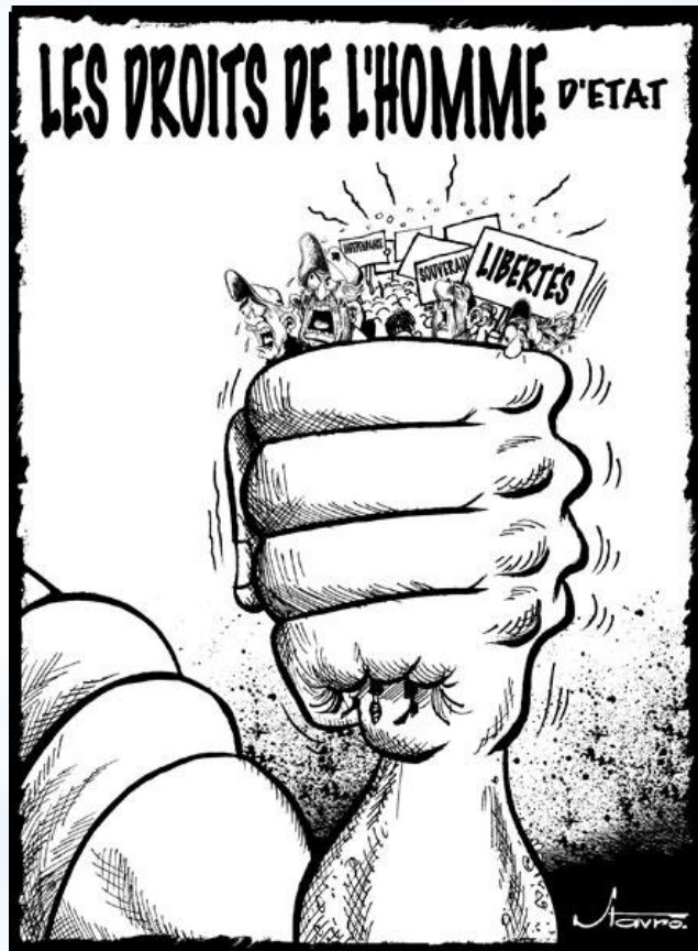
Международный пакт об экономических, социальных и культурных правах.