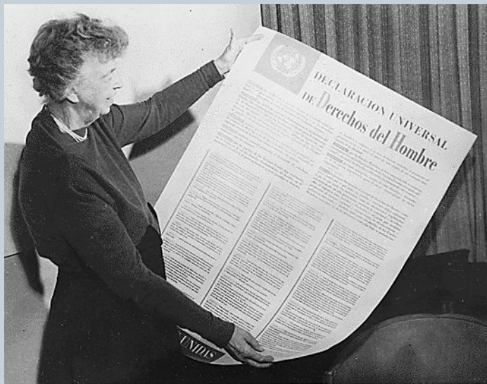
Элеонора Рузвельт с Испанской версией Декларации прав человека