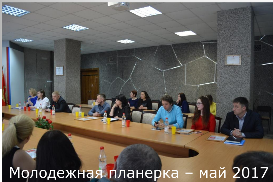
Молодежная планерка – май 2017