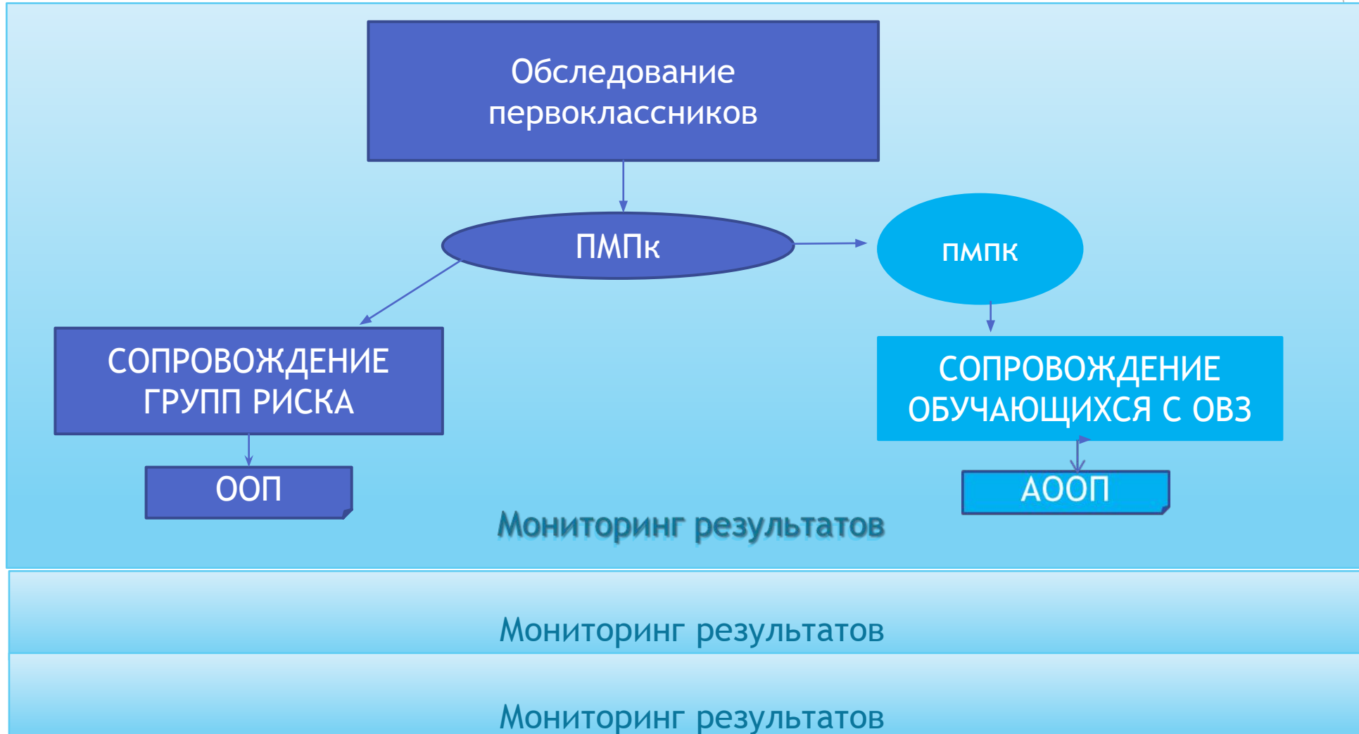
Схема сопровождения в ОО