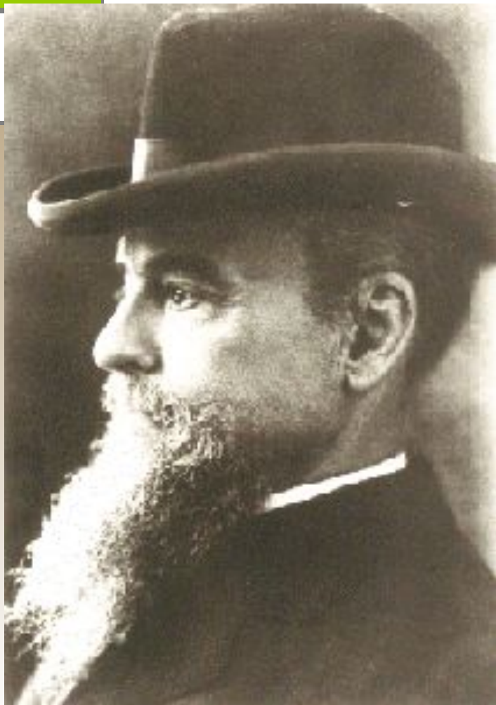
Парето Вильфредо (1848-1923), итальянский экономист и социолог.

Парето В. неизбежность деления общества на управляющую элиту и управляемые массы выводил из неравенства индивидуальных способностей людей , проявляющегося во всех сферах социальной жизни. Он прежде всего выделял элиту политическую, экономическую, военную, религиозную. «История – процесс постоянной «циркуляции элит», которая происходит в периоды революционных потрясений»