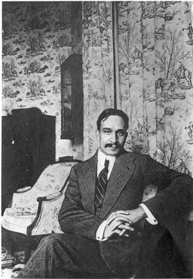
Роберт Михельс ( Robert Michels , 9.01 1876— 3.05 1936)

Суть концепции Р. Михельса состоит в том, что "демократия, чтобы сохранить себя и достичь известной стабильности", вынуждена создавать организацию. А это связано с выделением элиты. Лидеры никогда не уступают свою власть "массам", а только другим, новым лидерам. Необходимость управления государством требует создания аппарата, и власть концентрируется в его руках.