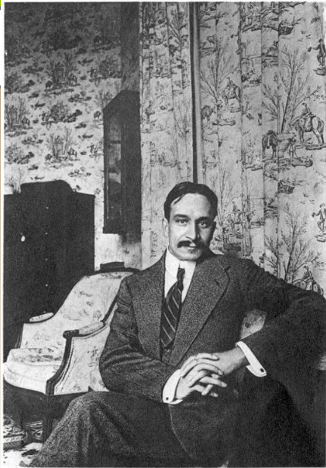
Роберт Михельс ( Robert Michels , 9.01 1876— 3.05 1936)

Суть концепции Р. Михельса состоит в том, что "демократия, чтобы сохранить себя и достичь известной стабильности", вынуждена создавать организацию. А это связано с выделением элиты . Лидеры никогда не уступают свою власть "массам", а только другим, новым лидерам. Необходимость управления государством требует создания аппарата, и власть концентрируется в его руках.