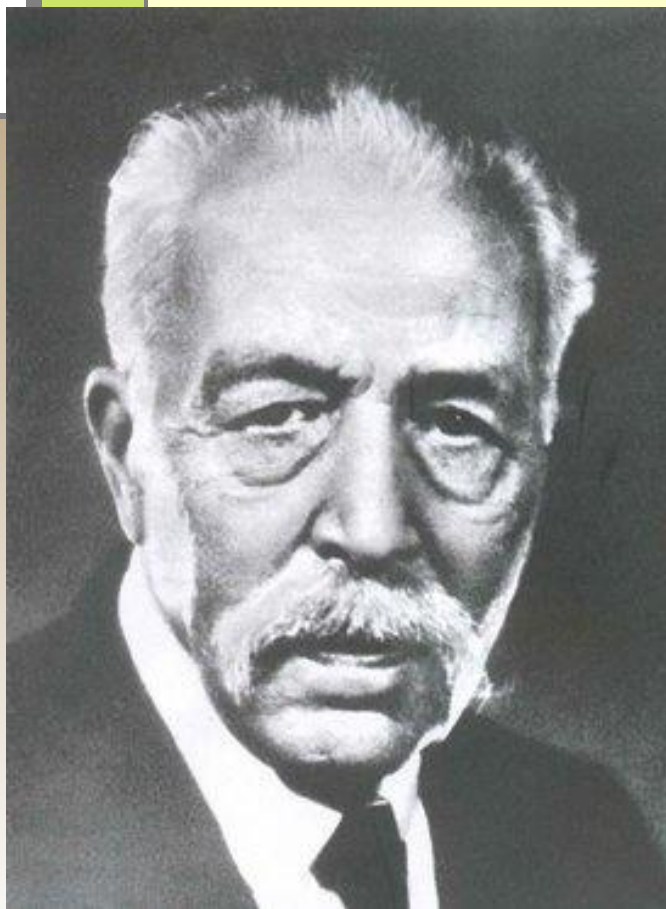
Гаэтано Моска (1858 -1941), итальянский юрист, социолог

Моска Г. пытался доказать неизбежное деление любого общества на две неравные по социальному положению и роли группы.