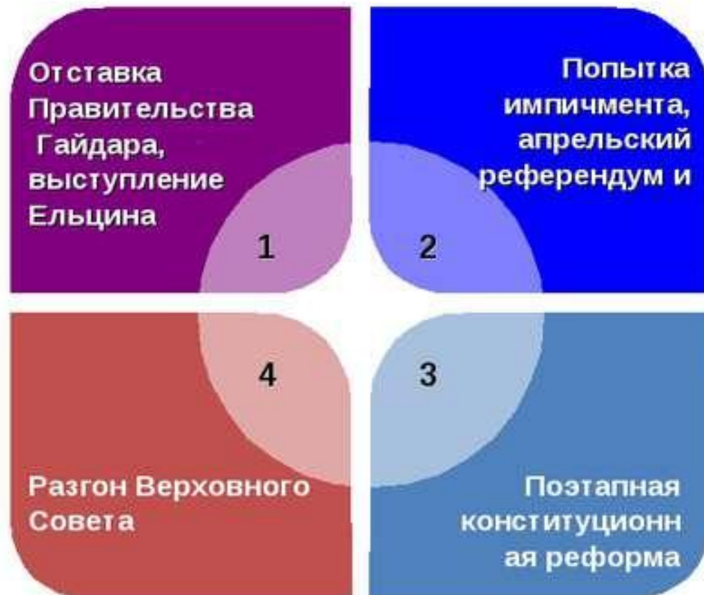
Политический кризис 1993 года