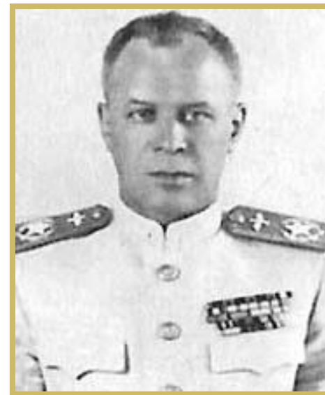
А. А. Новиков

Опасаясь возросшей в ходе войны популярности военных, Сталин санкционировал арест маршала авиации А. А. Новикова , ряда сослуживцев маршала Г. К. Жукова. Самому полководцу были предъявлены обвинения в сколачивании группы недовольных генералов и офицеров, в неблагодарности и неуважении к Сталину.