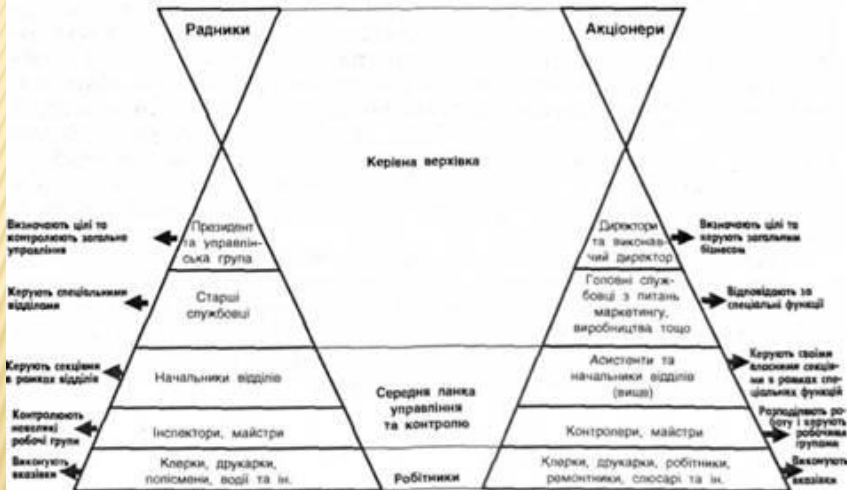
Мал. 11.1. Формальні відносини в організації