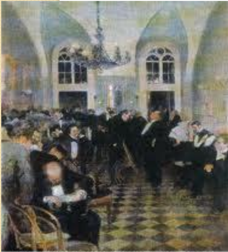
Д.А. Щербиновский. комната присяжных поверенных во время перерыва заседания. 1896

закреплен в отечественном законодательстве с учетом национальных особенностей Российской Федерации. Суть этого принципа заключается в том, что судопроизводство в России должно вестись на русском языке, однако в республиках, входящих в состав РФ, может использоваться соответствующий государственный язык. Всем лицам, участвующим в рассмотрении дел и не владеющим языком, на котором ведется судопроизводство, обеспечивается возможность пользоваться помощью переводчика