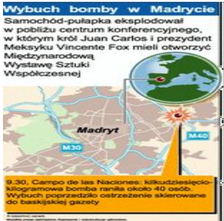
Madryt, luty 2005

motywacja etnonacjonalistyczna i separatystyczna: Jej istota polega na usprawiedliwianiu aktywności terrorystycznej dążeniami określonej grupy narodowej lub etnicznej do politycznego usamodzielnienia się i uzyskania niepodległości względnie zwiększenia autonomii.