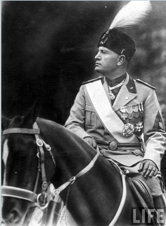
Бенито Муссолини Гитлер