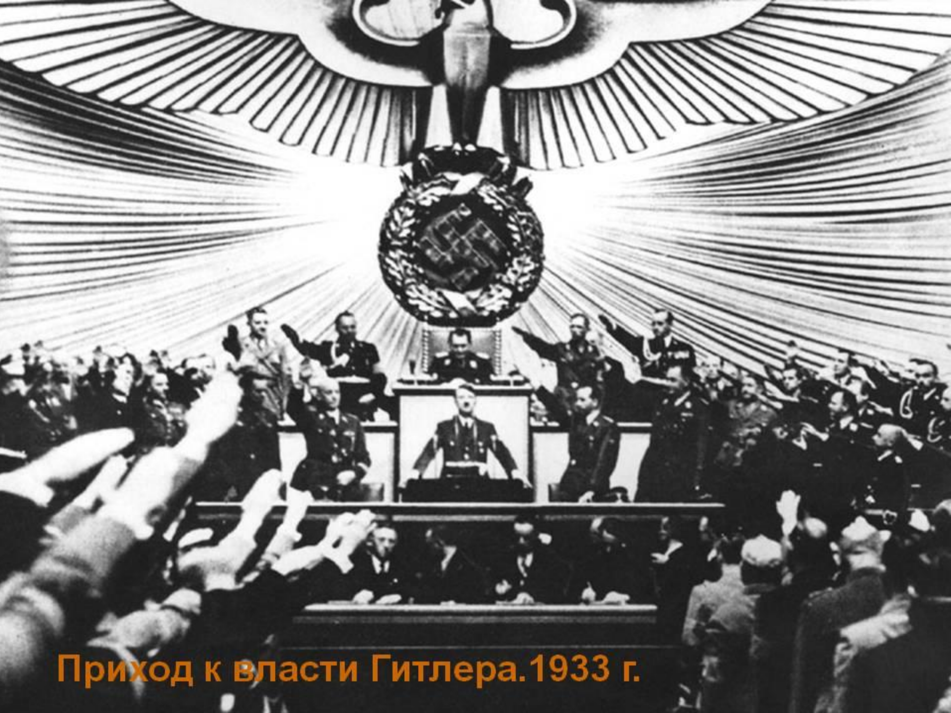
Приход к власти Гитлера. 1933 г.