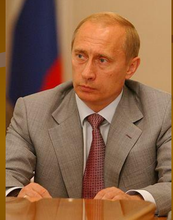
Борис Николаевич Ельцин