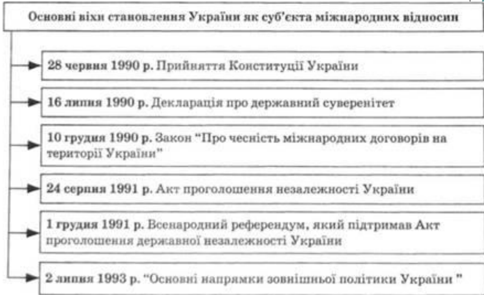
Рис. 15.5. Становлення України як суб'єкта міжнародних відносин