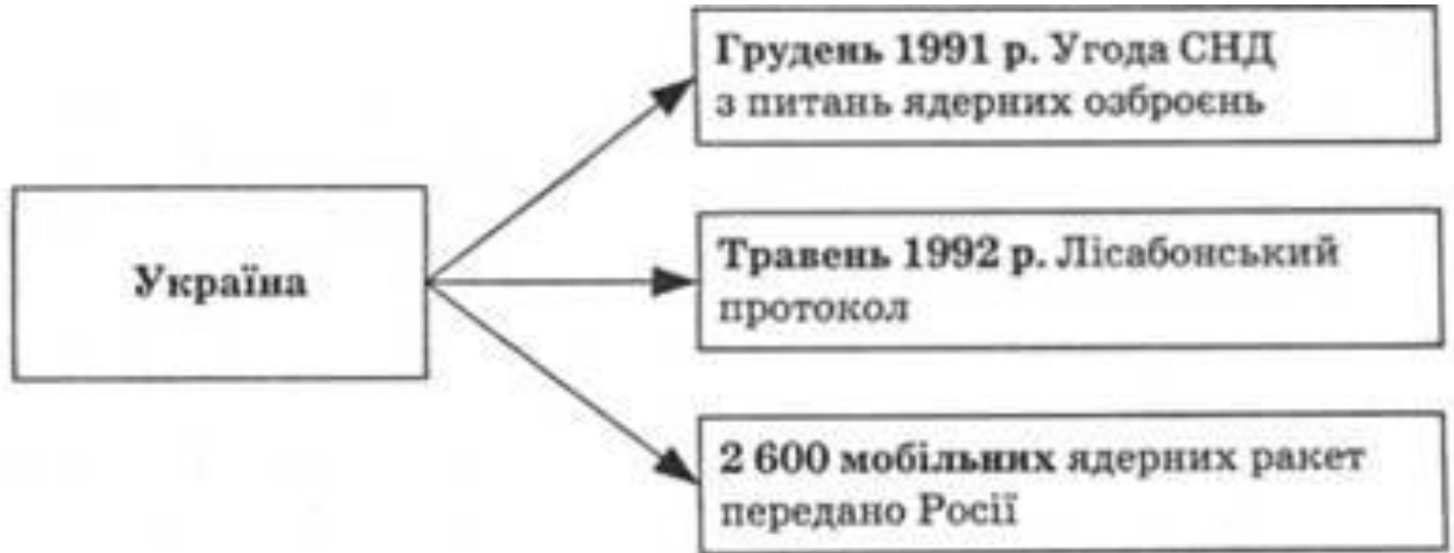
Рис. 15.7. Шлях України до без'ядерного статусу