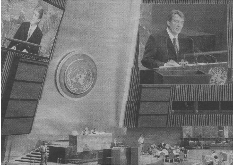
Виступ Президента України Віктора Ющенка на сесії Генеральної Асамблеї ООН. Нью-Йорк, 2006 р.

“Міжнародний авторитет і імідж України будуть визначати два основних чинники: