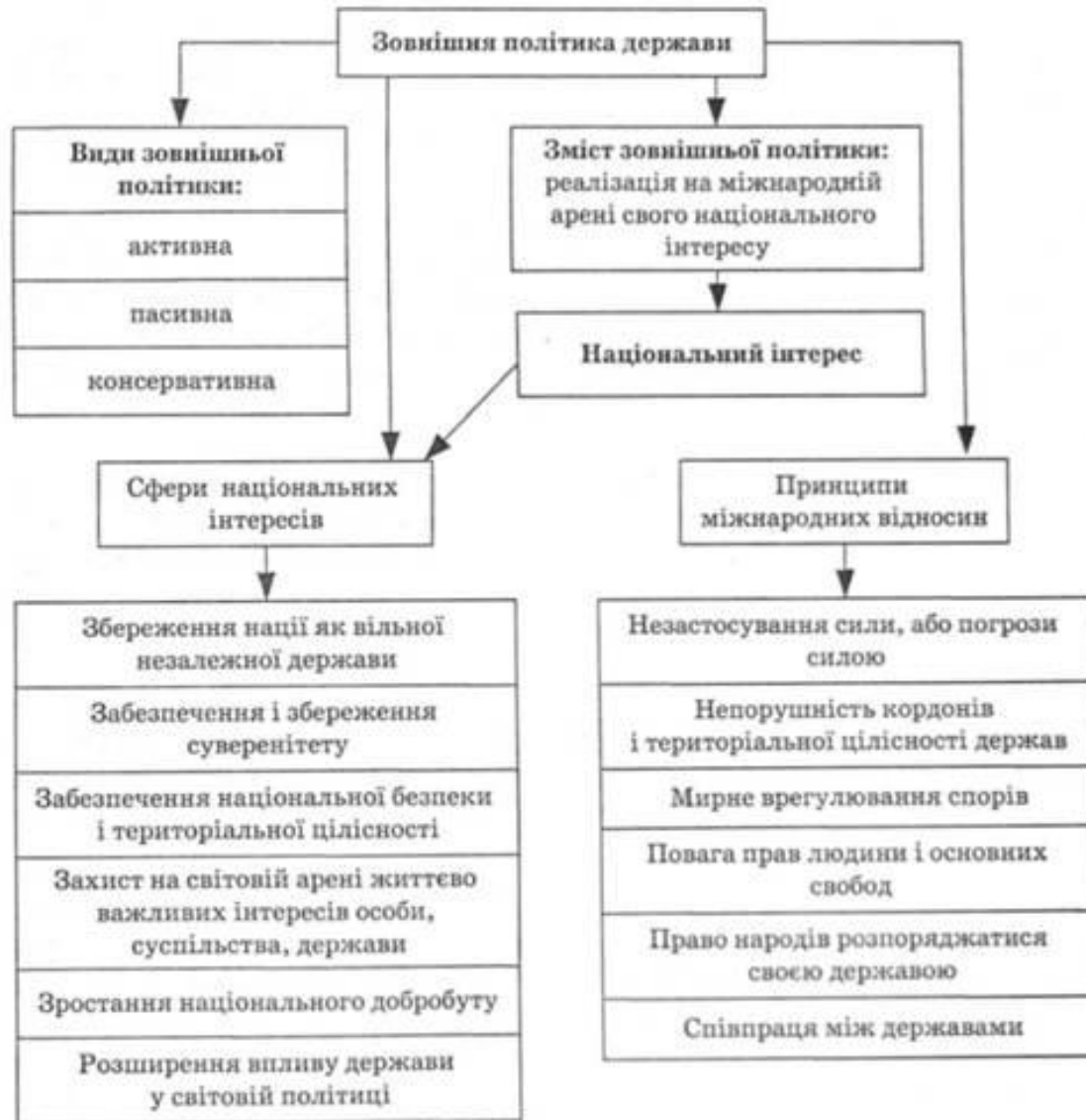
Рис. 15.6. Зовнішня політика держави