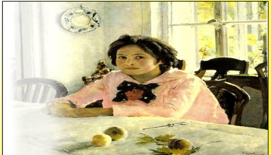
«Девочка с персиками» В.Серов