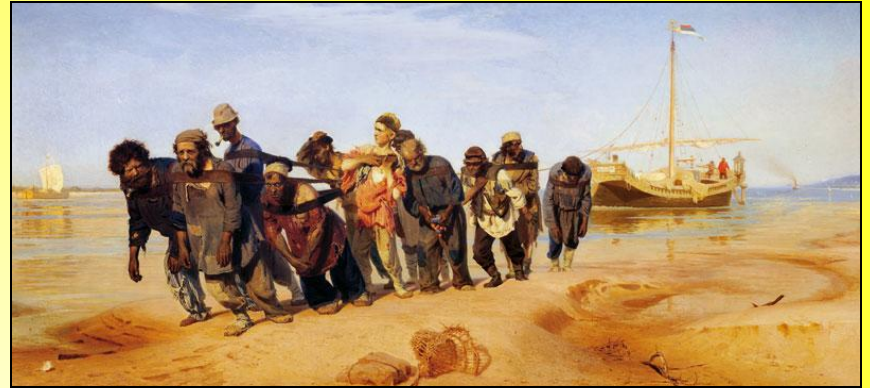
«Бурлаки на Волге» И.Репин