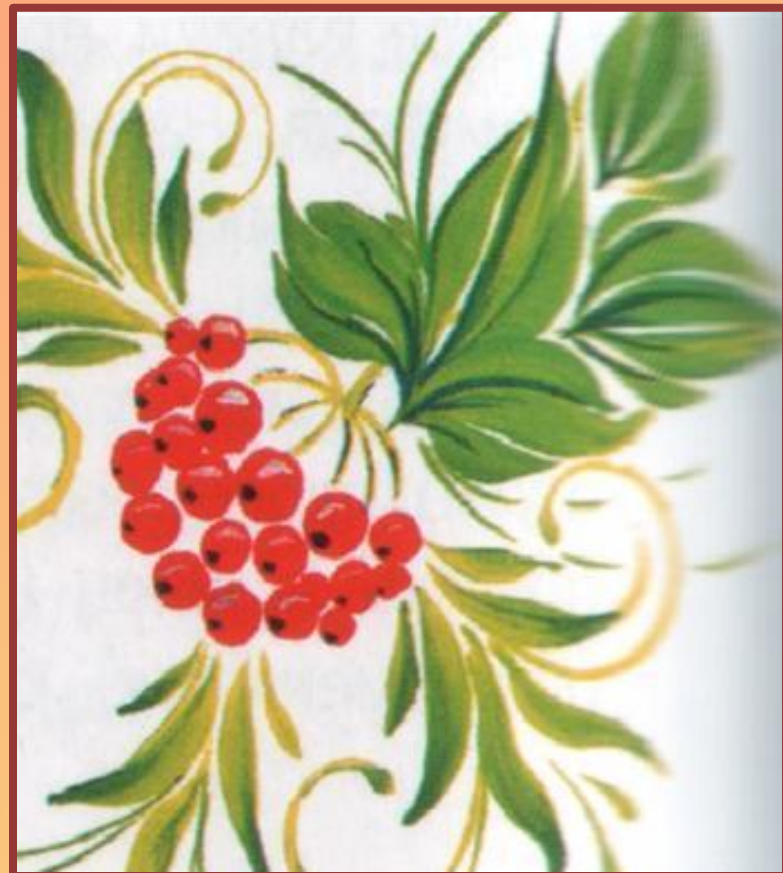
Петриковска я роспись