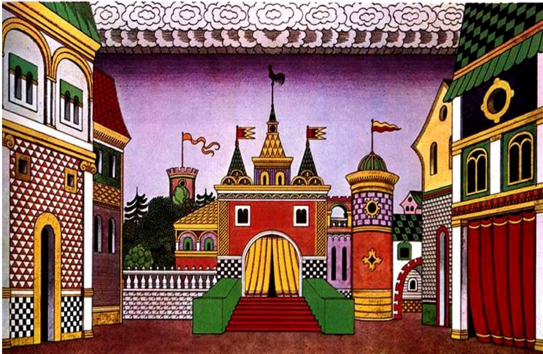
Билибин И.Я. Эскиз декорации к опере Н.А.Римского-Корсакова «Золотой петушок»