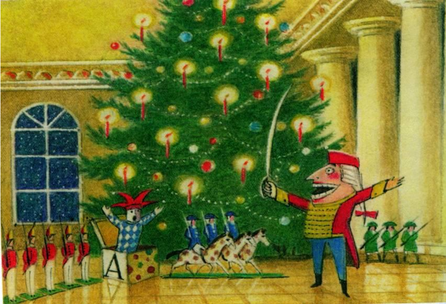
Эскиз декорации к балету П. И. Чайковского «Щелкунчик»