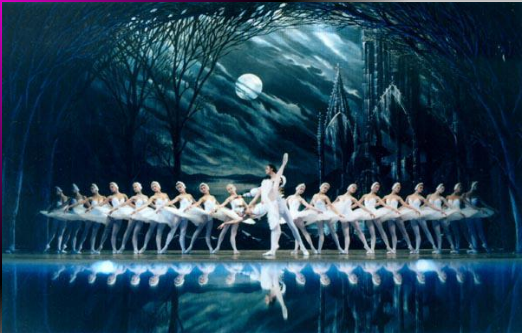
Балет П.И.Чайковского «Лебединое озеро»