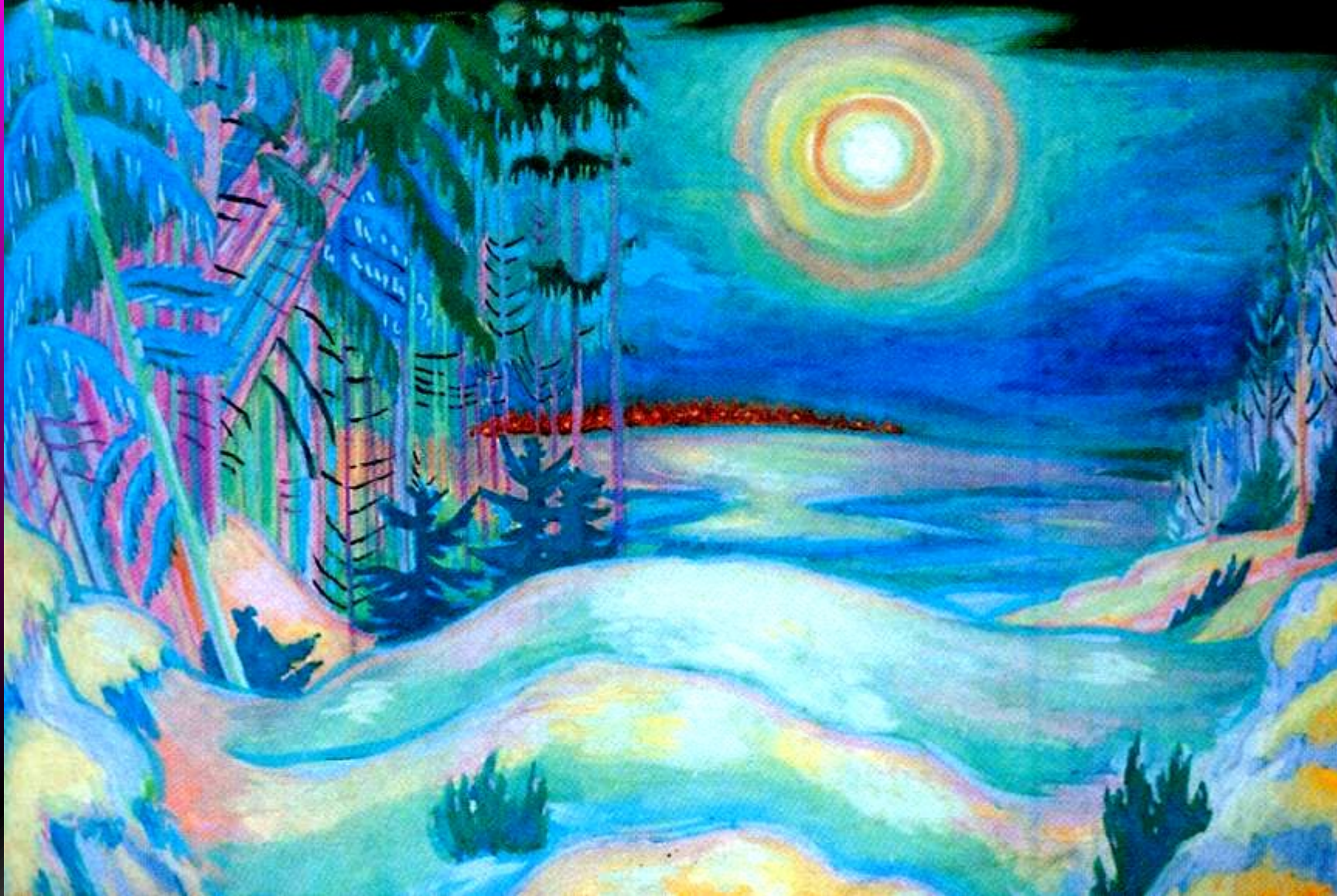
Д.Стеллецкий. Эскиз декорации к опере Н. Римского-Корсакова «Снегурочка»