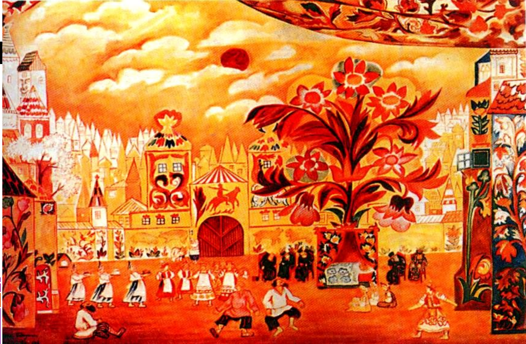
Н. Гончарова. Эскиз декорации к опере Н.Римского-Корсакова «Золотой петушок»