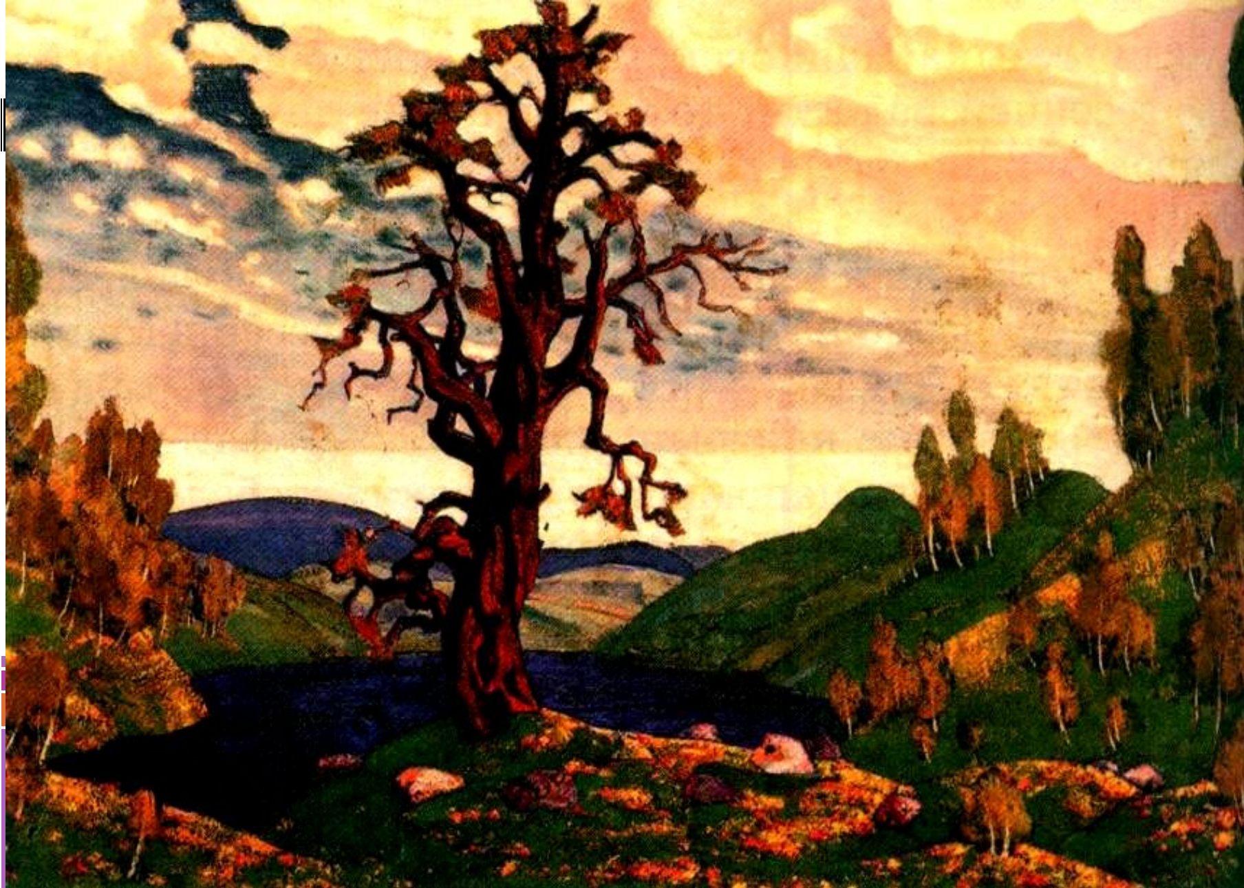
Н.Рерих. Декорация к балету И.Стравинского «Весна священная»