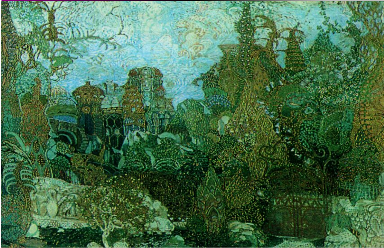
А Головин. Кашеево царство. Эскиз декорации к опере И. Стравинского «Жар-птица»

Живописное или архитектурное изображение места и обстановки театрального действия, устанавливаемое на сцене (театр.).