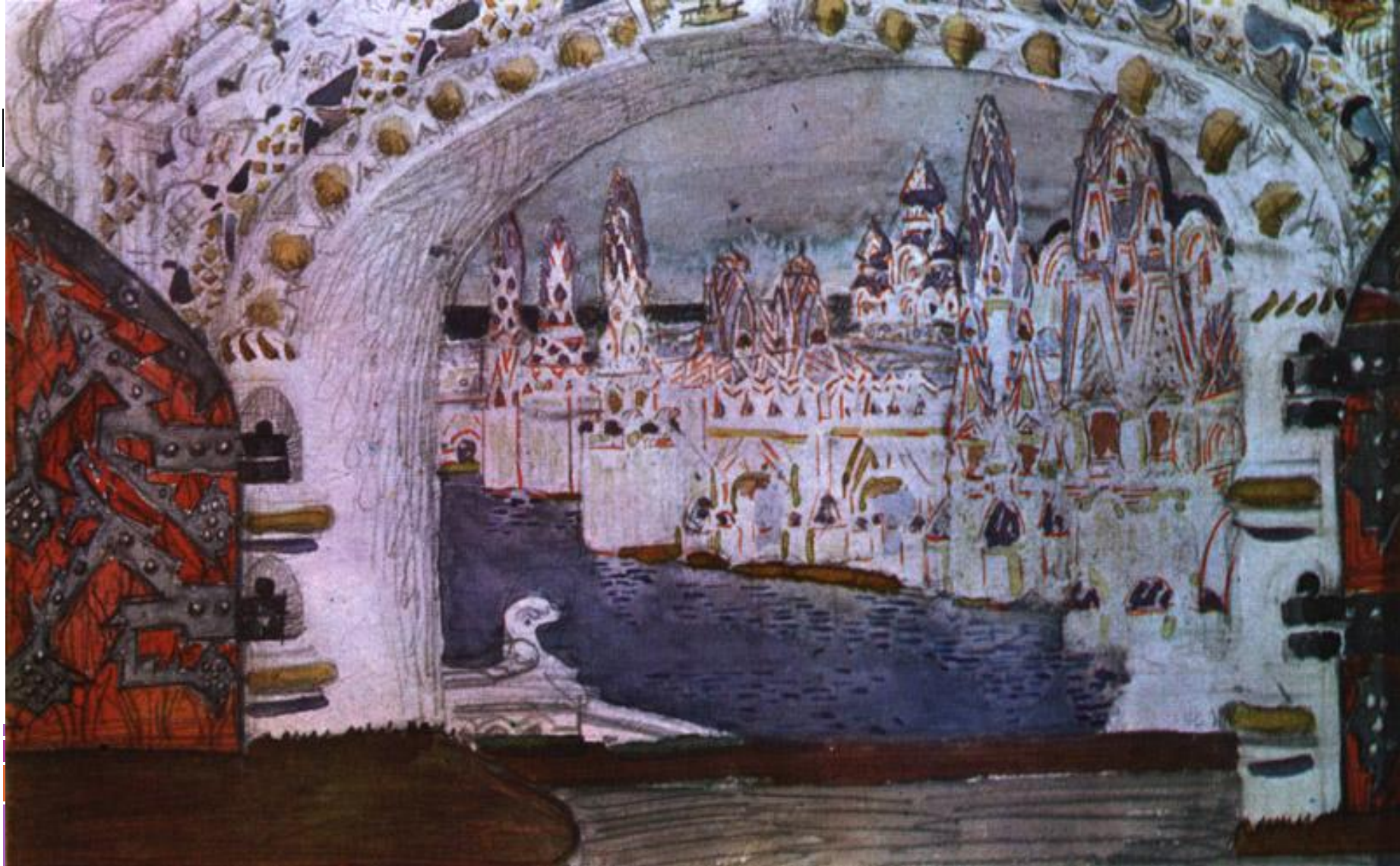
Врубель М.А. Эскиз декорации к опере Н.А.Римского-Корсакова «Сказка о царе Салтане»