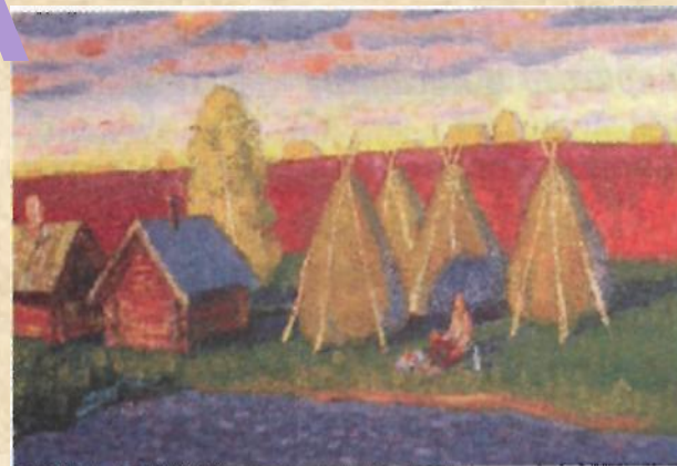
Ю. Лобачев. «У доема»