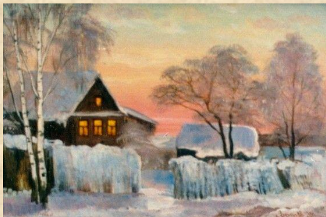
О. Золотова «Сумерки»