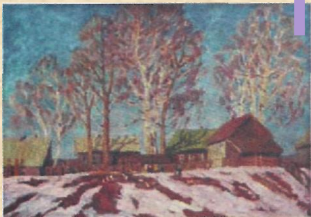
В. Телегин «Март»